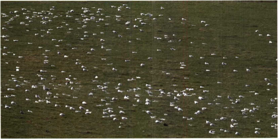
130 Mediterranean Gulls / Zwartkopmeeuwen Larus melanocephalus , part of roosting flock (c one third), Outreau, Pas-de-Calais, France, 15 July 1995