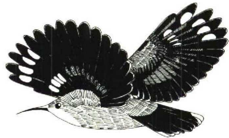
FIGURE 4 Wallcreeper Tichodroma muraria , female in flight from side (Miroslav Saniga). Note two white elliptical spots on p2-5 and rusty spots (shaded) on p7-10 and s1-6

and uppertail were darker in males (brownish-black) than in females (black-brown). The females generally appeared to be paler and duller than the males. The data provide no correlation between the extent of black on throat and breast and the age of the birds. Further studies may prove or disprove any such link.