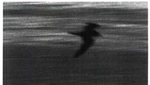
153 Bulwers Stormvogel / Bulwer's Petrel Bulweria bulwerii , Maasvlakte, Zuidholland, 21 augustus 1995

Er zullen heel wat wenkbrauwen gefronst zijn bij het aflezen van de pieperboodschap: Bulwers Stormvogel...?, ter plaatse aanwezig...? Ongeveer 30 personen die alert gereageerd hebben en niet te ver van de Westplaat wonen of werken hebben de vogel nog kunnen zien. Zij moesten wel even wachten, want net toe de eersten arriveerden, was de vogel op zee uit beeld verdwenen. Gelukkig vond Wim Wiegant hem na een half uur terug, zij het ver weg op zee. Hier vloog de vogel enkele malen heen en weer om vervolgens om c 11:15 naar later bleek definitief uit beeld te verdwijnen, tot grote spijt van hen die te laat waren of zich niet aan hun doordeweekse verplichtingen konden onttrekken. De goudplevier hebben we verder maar laten zitten... AAT SCHAFTENAAR