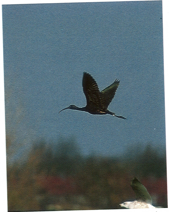
27 Zwarte Ibis / Glossy Ibis Plegadis falcinellus , Haarlem, Noordholland, november 1994 (Piet Munsterman)