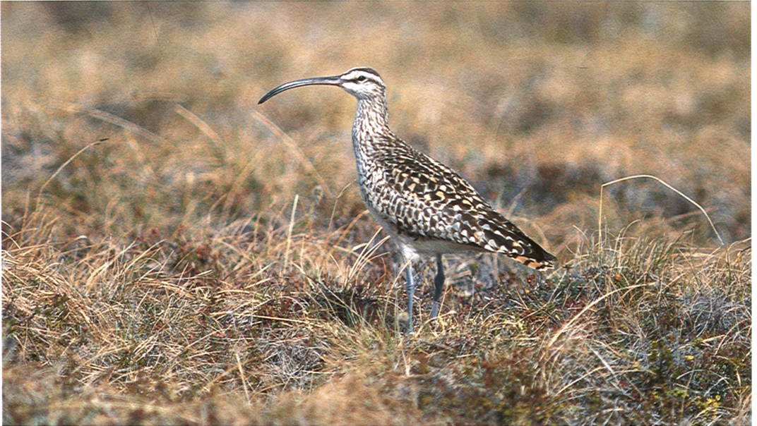
19 Bristle-thighed Curlew / Zuidzeewulp Numenius tahitiensis , Nome, Alaska, USA, June 1991 (Arnold W J Meijer)

After breeding, this curlew shows a very odd migration route. Instead of migrating southwards along the coast or across the interior, like most Nearctic waders, birds gather in flocks on the coast of western Alaska and then head straight out to cross the Pacific Ocean to their wintering grounds on (often tiny) islands in the Pacific. The normal wintering range extends from Caroline Island south and east to Fiji and through Eastern Polynesia to Pitcairn and Ducie Island (Hayman et al 1986). During migration, they also occur in Hawaii and on the Marquesas Islands. On their wintering grounds, the curlews mainly feed on