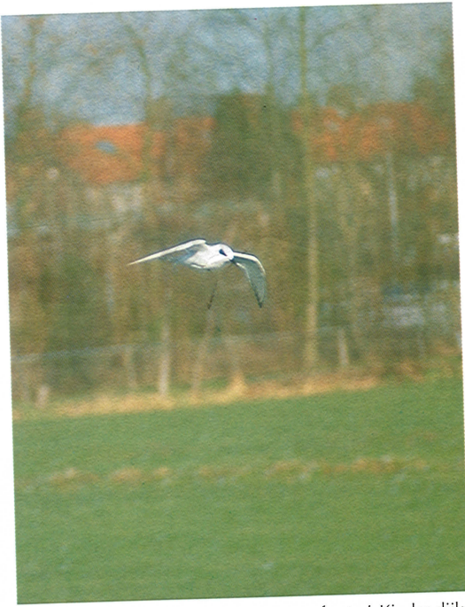
26 Forsters Stern / Forster's Tern Sterna forsteri , Kinderdijk, Zuidholland, 5 januari 1995