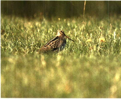
126 Poelsnip / Great Snipe Gallinago media , juveniel, Workumerwaard, Friesland, 6 augustus 1994