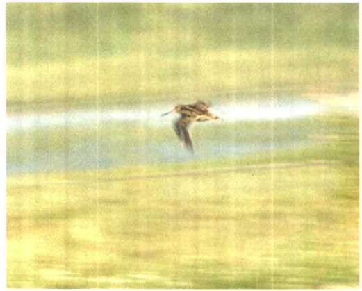
127 Poelsnip / Great Snipe Gallinago media , juveniel, Workumerwaard, Friesland, 31 juli 1994 (Oscar Endtz)

Hayman et al 1986). Het geluid en gedrag ondersteunen de determinatie. Voor verschillen met andere snipsoorten, zoals Stekelstaartsnip G. stenura , Siberische Snip G. megala en 'Amerikaanse Watersnip' G. (g) delicata (die alle drie een geheel gebandeerde ondervleugel hebben en in Westeuropa als dwaalgast kunnen voorkomen), wordt verwezen naar van Spanje et al (1995) en de daarin genoemde verwijzingen. Het feit dat de lichte vleugelstrepen op de bovenzijde relatief smal waren (zowel in zit als in vlucht) en de bandering op de buitenste staartpennen duiden op een juveniele vogel. Adulte Poelsnippen hebben veel bredere witte toppen aan de dekveren en daardoor meer opvallende en wittere vleugelstrepen en ongetekende witte buitenste staartpennen. Eerstejaars vogels krijgen deze vleugeltekening in november-december; in januari ruien de buitenste staartpennen naar volledig witte pennen en vanaf die tijd zijn onvolwassen vogels niet of nauwelijks meer te onderscheiden van adulte. De aanvaarding door de Commissie Dwaalgasten Nederlandse Avifauna (CDNA) van een Poelsnip bij Opeusden, Gelderland, op 12 januari 1980 als tweede-kalenderjaar is derhalve curieus en verdient heroverweging (cf Blankert & CDNA 1982).