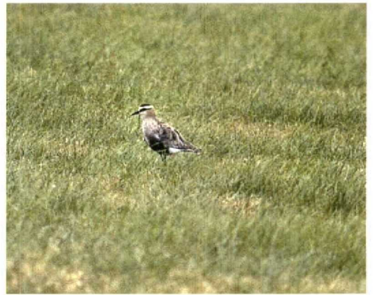
147-148 Dwergarend / Booted Eagle Hieraetus pennatus , donker vorm, Hoge Veluwe, Gelderland, 13 juli 1995 (Niels Gilissen) 149 Krekeltzanger / River Warbler Locustella fluviatilis , Groningen, Groningen, juli 1995 (Eric Koops) 150 Kuifkoekoek / Great Spotted Cuckoo Clamator glandarius , Schiermonnikoog, Friesland, 28 juli 1995 (Jan Mulder) 151 Grote Franjepoot / Wilson's Phalarope Phalaropus tricolor , Wevers Inlaag, Zeeland, 24 juni 1995 (Marc Guyt) 152 Steppekievit / Sociable Lapwing Chettusia gregaria , Kamerik, Utrecht, juli 1995 (Marten van Dijl)