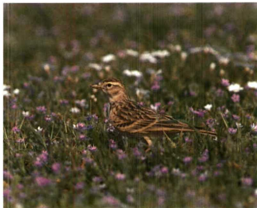
103 Vorkstaartplevier / Collared Pratincole Glareola pratincola , Lutjebroekerweel, Noordholland, 30 mei 1995 104 Vorkstaartplevier / Collared Pratincole Glareola pratincola , Lutjebroekerweel, Noordholland, 30 mei 1995 105 Grote Geelpootruiter / Greater Yellowlegs Tringa melanoleuca , eerste-zomer, De Braakman, Zeeland, 21 april 1995 106 Spenveruil / Hawk Owl Surnia ulula , Brunssum, Limburg, 2 april 1995 107 Siberische Tjiftjaf / Siberian Chiffchaff Phylloscopus collybita tristis , Schiedam, Zuidholland, april 1995 108 Kortteenleeuwerik / Short-toed Lark Calandrella brachydactyla , Katwijk aan Zee, Zuidholland, 5 mei 1995