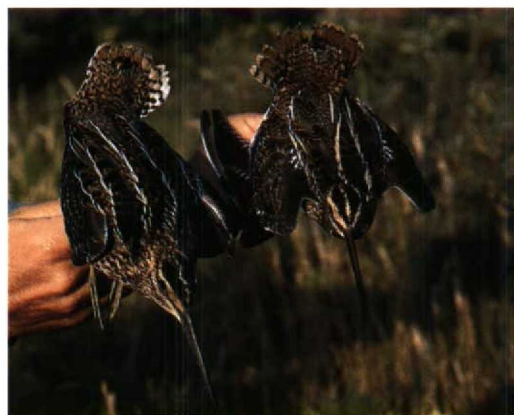
89 Poelsnip / Great Snipe Gallinago media , juveniel, Zandvoort, Noordholland, 26 juli 1994 (Arnoud B van den Berg; Vrs AW-duinen)