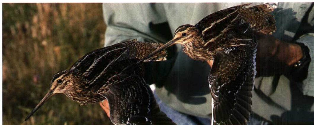
86-88 Poelsnip / Great Snipe Gallinago media (links) en Watersnip / Common Snipe G. gallinago , Zandvoort, Noordholland, 26 juli 1994 (Arnoud B van den Berg; Vrs AW-duinen)