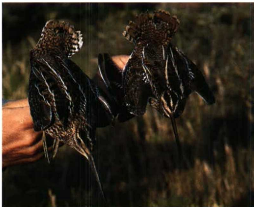
89 Poelsnip / Great Snipe Gallinago media , juveniel, Zandvoort, Noordholland, 26 juli 1994 (Arnoud B van den Berg; Vrs AW-duinen)