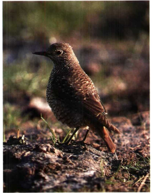
91 Rode Rotslijster / Rock Thrush Monticola saxatilis , female, Noorburen, Noordholland, 13 mei 1994 92-93 Rode Rotslijster / Rock Thrush Monticola saxatilis , female, Noorburen, Noordholland, 13 mei 1994