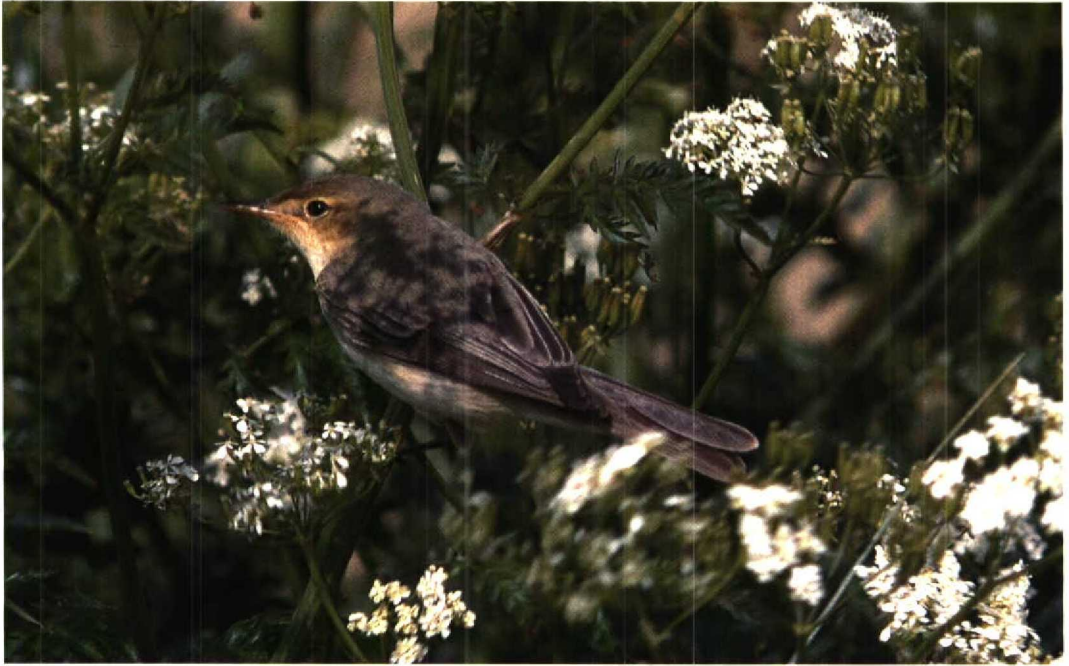
78 Melodious Warbler / Orpheusspotvogel Hippolais polyglotta , Rottumeroog, Groningen, 22 May 1993