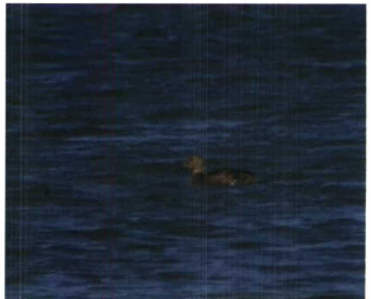
74 Iceland Gull / Kleine Burgemeester Larus glaucooides , adult, Vlissingen, Zeeland, February 1993 (Hans Gebuis) 75 Alpine Swift / Alpengierzwaluw Apus melba , juvenile, Westkapelle, Zeeland, 17 September 1993 (Peter L Meininger) 76 Ring-necked Duck / Ringsnaveleend Aythya collaris , male, Oostvaardersdijk, Flevoland, november 1993 (Arnoud B van den Berg) 77 King Eider / Koningseider Somateria spectabilis , adult female, De Cocksdorp, Texel, Noordholland, April 1993 (Arnoud B van den Berg)

Nieuwstraten, M Zekhuis). NOORDHOLLAND Julianadorp, 28-30 August, juvenile, photographed (D J Moerbeek et al).