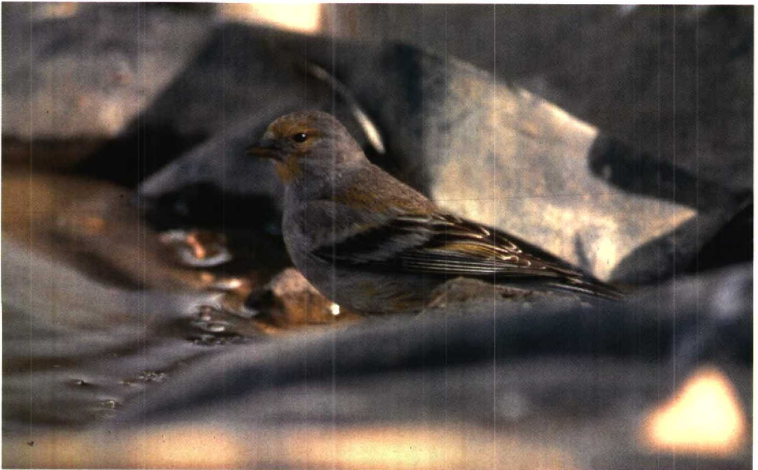
99 Citril Finch / Citroenkanarie Serinus citrinella , Casa Veyas, Mallorca, Spain, May 1995 (Tim Loseby)