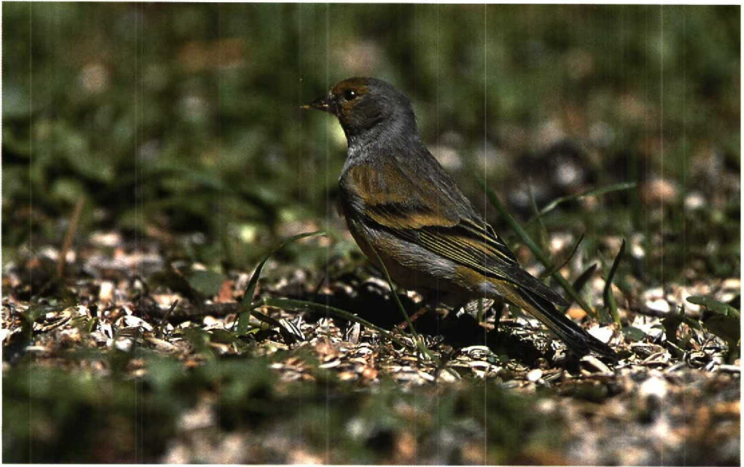
98 Citril Finch / Citroenkanarie Serinus citrinella , adult female, Kirkkonummi, Finland, May 1995 (Henry Letho)