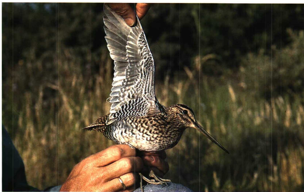
90 Poelsnip / Great Snipe Gallinago media , juveniel, Zandvoort, Noordholland, 26 juli 1994 (Arnoud B van den Berg; Vrs AW-duinen)

achterrands. Het patroon op de bovenzvleugel van Poelsnip verschilt echter toch aanzienlijk van dat van Watersnip door de duidelijke witte veertoppen aan de grote handdek- en duimvleugelveren, zodat in vlucht een witte tekening middenop de handvleugel opvalt. Bovendien heeft Watersnip een bredere witte vleugelachterrands dan Poelsnip en geen witte toppen aan de middelste armdekveren.