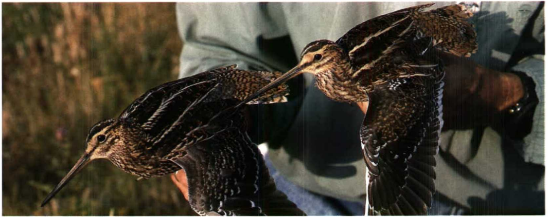
86-88 Poelsnip / Great Snipe Gallinago media (links) en Watersnip / Common Snipe G. gallinago , Zandvoort, Noordholland, 26 juli 1994 (Arnoud B van den Berg; Vrs AW-duinen)