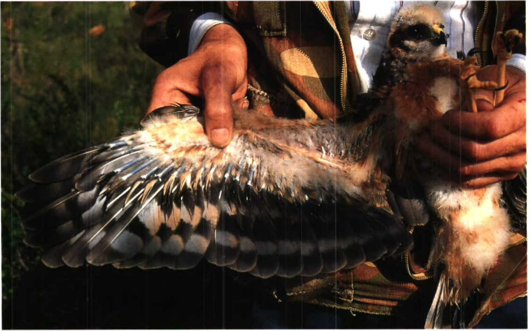
80 Hybrid Pallid x Montagu's Harrier / hybride Steppe- x Grauwe Kiekendief Circus macrourus x pygargus , youngest female, Savukoski, Finland, 27 July 1993. Note dark iris and Pallid Harrier-like underwing pattern 81 Hybrid Pallid x Montagu's Harrier / hybride Steppe- x Grauwe Kiekendief Circus macrourus x pygargus , youngest female, Savukoski, Finland, 7 August 1993. Note Pallid Harrier-like pattern on primaries