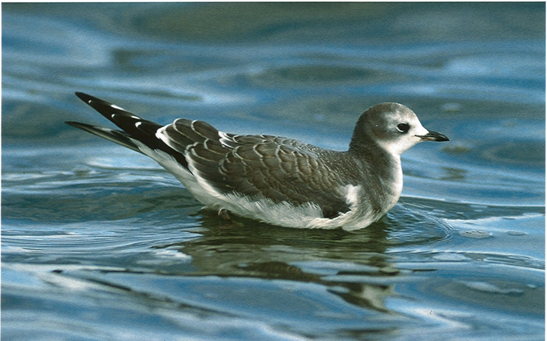
10 Vorkstaartmeeuw / Sabine's Gull Larus sabini, Oostvaardersdijk, Flevoland, september 1990