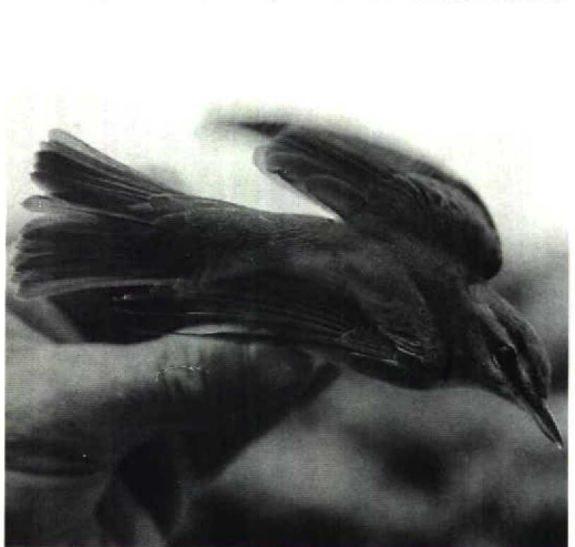
83 Roodoogvireo / Red-eyed Vireo Vireo olivaceus , Vlieland, Friesland, 24 september 1991

We apologize for this regrettable mistake. EDITORS