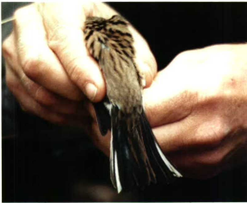
86-88 Maskergors / Black-faced Bunting Emberiza spodocephala , eerste-winter mannetje, Schiermonnikoog, Friesland, 28 oktober 1993

Lewington, I, Alström, P, & Colston, P 1991. A field guide to the rare birds of Britain and Europe. Londen.