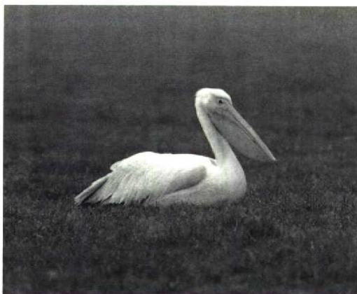
84 Roze Pelikaan / White Pelican Pelecanus onocrotalus , Havelte, Drenthe, november 1987 (Leo J R Boon)

Op grond van bovenstaande gegevens lijkt het (nog steeds) zeer goed mogelijk dat incidenteel wilde Roze Pelikanen afdwalen naar Westeuropa. Gezien de sterk teruggelopen broedpopulatie is de kans op (met name groepjes) zwerende vogels echter weliswaar aanzienlijk kleiner geworden maar daartegenover staat dat de toegenomen waarnemersintensiteit kan bijdragen aan een toename van het aantal meldingen. Hoewel ontsnapte vogels zeker verantwoordelijk kunnen zijn voor recente gevallen in Westeuropa, achten