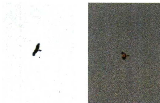
80-81 Dwergarend / Booted Eagle Hieraaetus pennatus , donkere vorm, Leersumse Veld, Utrecht, 30 mei 1992 (Albert J Dees)