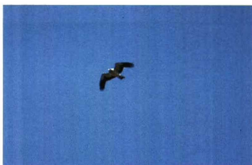
82 Dwergarend / Booted Eagle Hieraaetus pennatus , lichte vorm, Keersluisplas, Flevoland, 24 april 1993 (Hein Prinsen)

kwam DF tot de volgende reactie: 'Good to see the slides in original. My judgement is mainly based on slides 1, 2 and 4, which show most plumage details and it is: Booted Eagle! The shape of the bird is right for Booted, with longish and square-cut tail and rather short wings with ample tip. The coloration of the upperparts fits perfectly with Booted (upperwing and tail) and from below the pale inner primaries can be seen. Combining all the slides I think you can safely identify the bird as a Booted Eagle, despite the low quality of the slides. The plumage is OK for Booted and all the slides together show the shape of the bird reliably enough to rule out any similarly plumaged Buzzard or Honey Buzzard. In addition the observer has seen the white 'head-lights' at the wing bases, which can not be seen in the slides.'