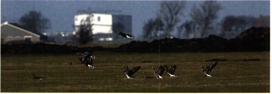
61 Dwergganzen / Lesser White-fronted Geese Anser erythropus , groep van zes, Ferwoude, Friesland, 30 januari 1994 (Arnoud B van den Berg) 62 Kleine Canadese Gans / Lesser Canada Goose Branta canadensis ssp, Wonneburen, Friesland, 30 januari 1994 (Paul Knolle)