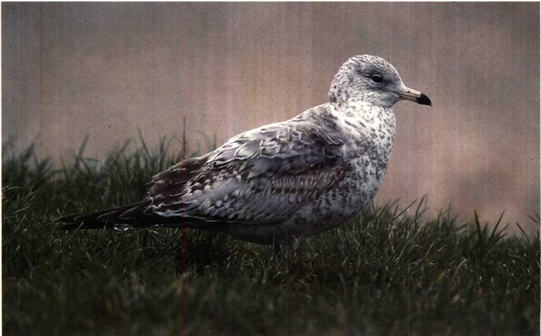
53 Ring-billed Gull / Ringsnavelmeeuw Larus delawarensis , Greatstone-on-Sea, Kent, England, January 1994 (Tim Loseby)