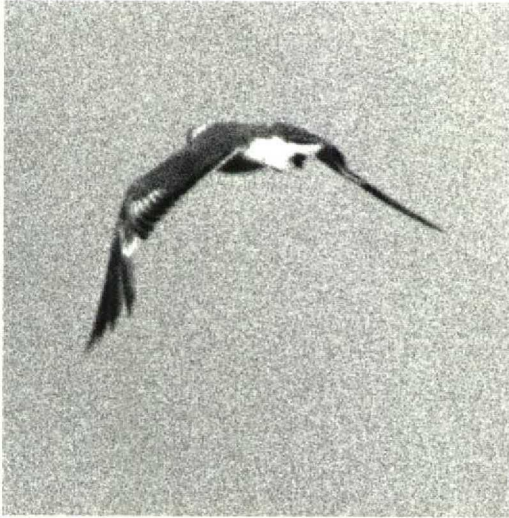
44 Franklin's Gull / Franklins Meeuw Larus pipixcan , first-year, moulting to first-summer or second-winter plumage, showing largely juvenile/first-winter-type wing and some juvenile rectrices, Wernhout, Noordbrabant, Netherlands, 15 June 1987

schuren (1976) recorded 'occasional individuals' in Chile in February 1976 with 'first-winter-type outer primaries and primary coverts and otherwise adult-like plumage', thought to be 'probably somewhat backward second-year individuals'.