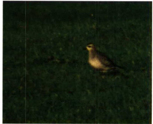
42 Amerikaanse Goudplevier / American Golden Plover Pluvialis dominica , Stavoren, Friesland, 19 november 1989 (Klaas Zwaan)

naar borst. Flank grijswit tot bruinwit met donkere vlekjes en schubjes, overgaand in zwarte middenbuik. Op verse geruide (lichte) winterkleedveren geen geel zichtbaar. Onregelmatige tekening en overgang van zwarte buik naar flanken enigszins lijkend op buiktekening van Kolgans Anser albifrons . Zwart tot op onderbuik doorlopend. Anaalstreek en onderstaartdekveren wit met aan één zijde geïsoleerd zwart vlekje op onderstaartdekveren.