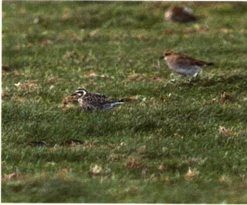
41 Amerikaanse Goudplevier / American Golden Plover Pluvialis dominica , Texel, Noordholland, oktober 1989 (René Pop)