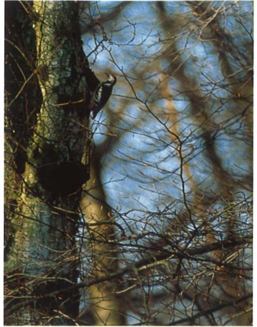
58 Grote Trap / Great Bustard Otis tarda , mannetje, Meddo, Gelderland, februari 1994 59 Middelste Bonte Specht / Middle Spotted Woodpecker Dendrocopos medius , Vijlenerbos, Epen, Limburg, 19 februari 1994 60 Ijsduiker / Great Northern Diver Gavia immer , IJmuiden, Noordholland, 9 januari 1994