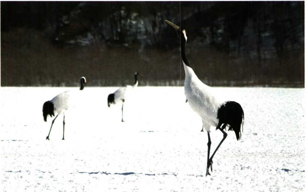
32 Japanese Crane / Chinese Kraanvogel Grus japonensis , Kushiro, Hokkaido, Japan, 5 March 1994 (Enno B Ebels)