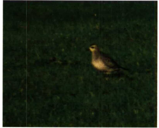
42 Amerikaanse Goudplevier / American Golden Plover Pluvialis dominica , Stavoren, Friesland, 19 november 1989

naar borst. Flank grijswit tot bruinwit met donkere vlekjes en schubjes, overgaand in zwarte middenbuik. Op verse geruide (lichte) winterkleedveren geen geel zichtbaar. Onregelmatige tekening en overgang van zwarte buik naar flanken enigszins lijkend op buiktekening van Kolgans Anser albifrons . Zwart tot op onderbuik doorlopend. Anaalstreek en onderstaartdekveren wit met aan één zijde geïsoleerd zwart vlekje op onderstaartdekveren.