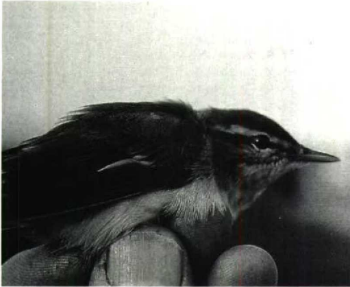
45 Roodoogvireo / Red-eyed Vireo Vireo olivaceus , Vlieland, Friesland, 24 september 1991 (Kees Terpstra)