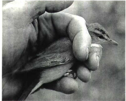
46 Roodoogvireo / Red-eyed Vireo Vireo olivaceus , Vlieland, Friesland, 2 oktober 1991 (Kees Terpstra)

Op 2 oktober 1991 werden op dezelfde plek door KT tussen 08:45 en 17:00 34 vogels gevangen en geringd, waaronder verbazend genoeg opnieuw een Roodoogvireo (ring Arnhem B833381). Ook deze vogel behoorde tot de ondersoort V o olivaceus . De beschrijving van verenkleed en naakte delen en de vleugelformule van deze vogel komen overeen met het exemplaar van 24 september. De maten waren echter verschillend: vleugel 79 mm, snavel 15 mm, staart 47 mm, tarsus 19.5 mm, afstand snavelpunt tot achterzijde kop 33.5 mm, lengte 148 mm, gewicht 18.5 g. De staartpunten waren spits en rafelig. Op grond hiervan werd dit exemplaar gedetermineerd als eerstejaars. Omdat een tweedejaars-vogel altijd geheel geruide staartpennen heeft (met ronde top) kan in dit geval met zekerheid worden gesteld dat de vogel een eerstejaars betrof (Kees Roselaar in litt). De bruinrode oogkleur en de lichtgele zweem op de onderstaartdekveren ondersteunen deze leeftijdsbepaling. De vleugellengte van 79 mm duidt op een vrouwtje.