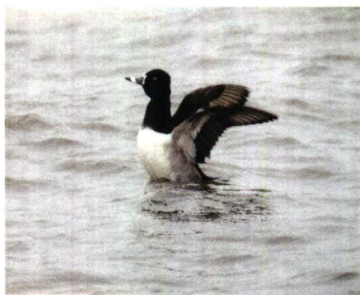
23 Ringsnaveleend / Ring-necked Duck Aythya collaris , Oostvaardersdijk, Flevoland, november 1993 (Lammert van der Veen) 24 Ringsnaveleend / Ring-necked Duck Aythya collaris , Oostvaardersdijk, Flevoland, november 1993 (Jaap van 't Hof)