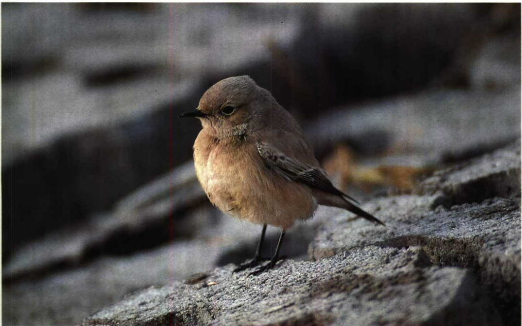
22 Desert Wheatear / Woestijntapuit Oenanthe deserti , Heacham, Norfolk, England, November 1993

was reported from Eilat. A Barred Warbler S nisoria at Fareham, Hampshire, England, on 30 November was even later than the one at Newcastle, Wicklow, Ireland, on 16-22 November (cf Dutch Birding 15: 281, 1993). In Britain, c 15 Pallas's Warblers Phylloscopus proregulus were reported during November. In France, only one was found this autumn, in Vannes, Morbihan, on 31 October. Hume's Yellow-browed Warblers P humei were seen on Christiansø, Denmark, on 28-31 October, at Flamborough Head, Humberside, England, on 5-9 November and at Strumble Head, Dyfed, Wales, on 20 November. A Short-toed Treecreeper C brachydactyla remained present at Dungeness, Kent, England, until at least 11 December (cf Dutch Birding 15: 281, 1993). A Dusky Warbler Phylloscopus fuscatu s was present at Santa Barbara, California, USA, on 22-23 October. In the Netherlands, after being eradicated in the 1920s, Ravens Corvus corax were re-introduced in 1966, and in 1976-86 3-9 pairs bred annually in the Veluwe, Gelderland, where numbers increased markedly since 1987 to 50 breeding and 31 territorial pairs in 1992 (Limosa 66: 107-166, 1993). In December, a Snowfinch Montifringilla nivalis was discovered on Mallorca, Spain. From 27 November until at least 9 January 1994, a first-winter male Two-barred Crossbill Loxia leucoptera remained at Baarn, Utrecht, the Netherlands. In Dorchester, Dorset, a Dark-eyed Junco Junco hyemalis on 7-19 November was trapped