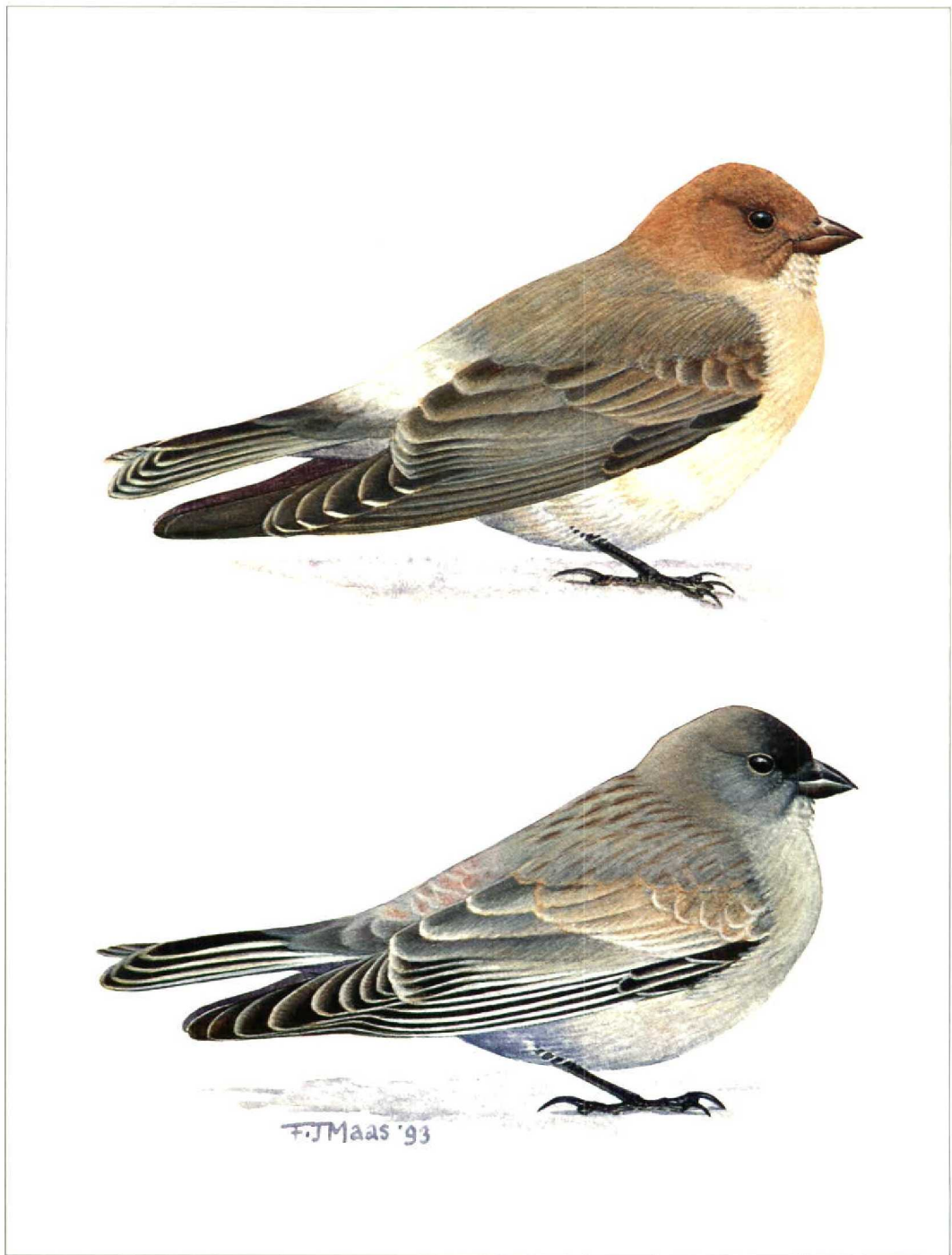
FIGURE 1 Adults of Sillem's Mountain-finch Leucosticte sillemi (top) and Brandt's Mountain-finch L. brandti (bottom) (Frits Jan Maas)