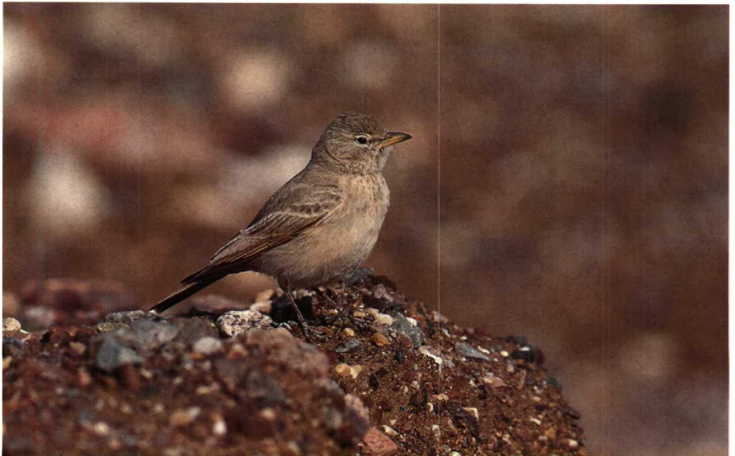
6 Desert Lark / Woestijnleeuwerik Ammomanes deserti , Eilat, Israel, March 1990 ( René Pop )