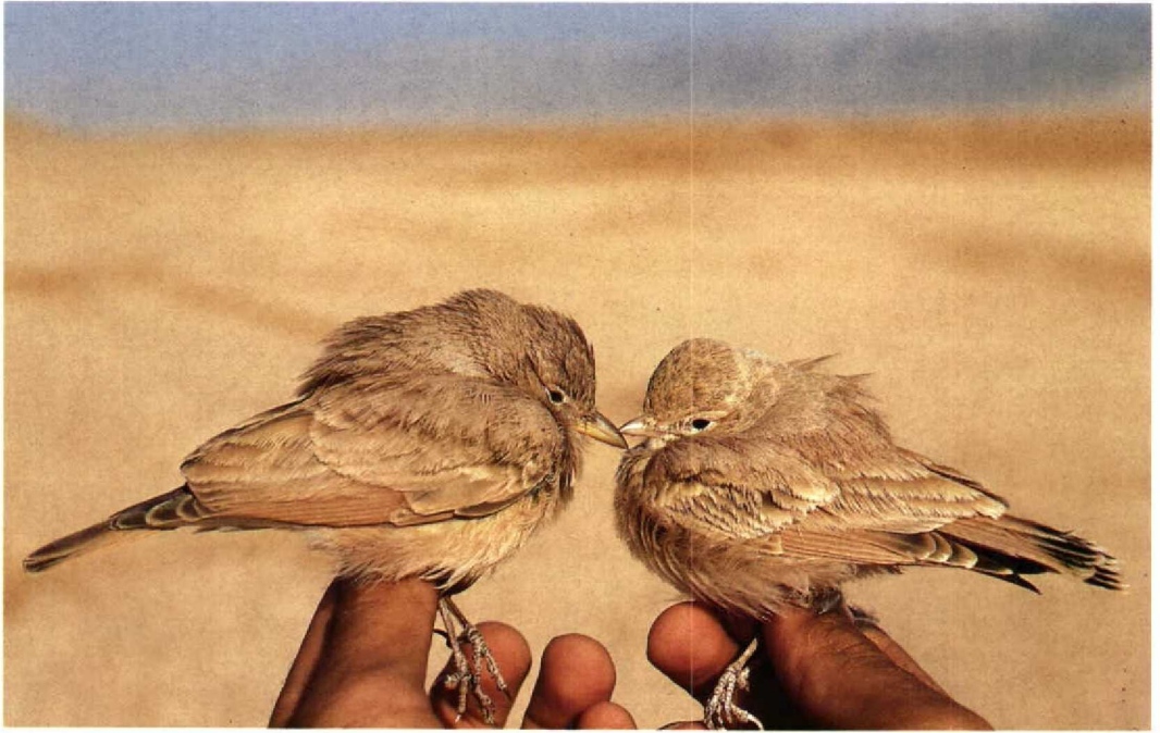
5 Desert Lark / Woestijnleeuwerik Ammomanes deserti (left) and Bar-tailed Desert Lark / Rosse Woestijnleeuwerik Ammomanes cincturus , Israel, winter of 1988/89 ( Hadoram Shirihai )