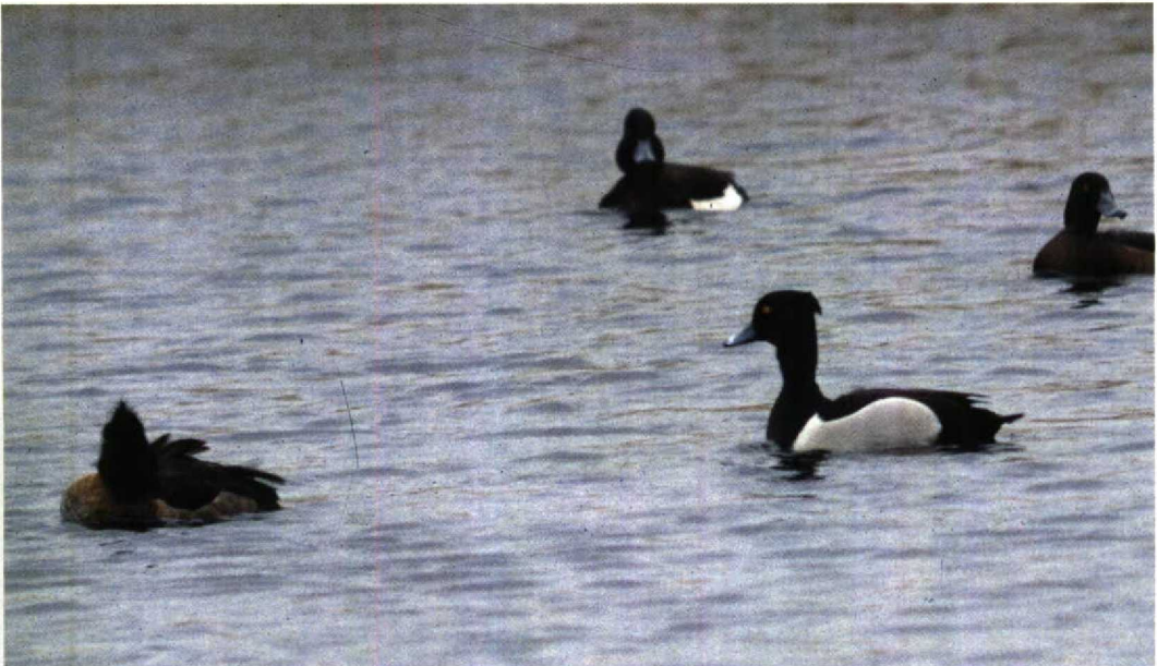
9 Hybride Ringsnaveleend x Kuifeend / hybrid Ring-necked x Tufted Duck Aythya collaris x fuligula , De Hoge Dijk, Noordholland, februari 1993 (Hans Kruidwagen)

Een andere hybride Ringsnaveleend x Kuifeend bevond zich van 24 april tot 1 mei 1992 bij Kew Green, Greater London, Groot-Brittannië