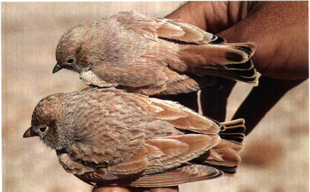
2 Bar-tailed Desert Lark / Rosse Woestijnleeuwerik Ammomanes cincturus (upper) and Dunn's Lark / Dunns Leeuwerik Eremalauda dunnii , Arava, Israel, November 1988 (Hadoram Shirihi)