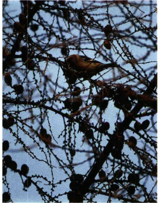
28 Roodhalsgans / Red-breasted Goose Branta ruficollis , Den Bommel, Zuidholland, december 1993 29 Witbandkruisbek / Two-barred Crossbill Loxia leucoptera , Baarn, Utrecht, 29 november 1993 30 Waterspreeuw / Dipper Cinclus cinclus , Norgerhaven, Drenthe, oktober 1993