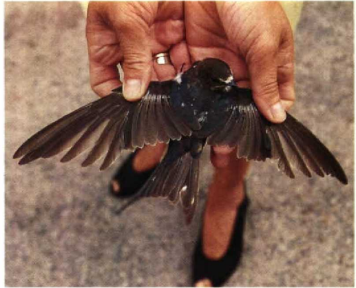
11 Barn Swallow / Boerenzwaluw Hirundo rustica , juvenile moulting flight-feathers, 4 July 1992, Veluwe-meer near Elburg, Gelderland

Bennie van den Brink, Zomerdijk 86, 8079 TL Noordeinde, Netherlands