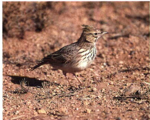
12 Thekla Lark / Theklaleeuwerik Galerida theklae showing short bill and crest, Zeida, Morocco, November 1990

Lark are longer than in European birds. Birds with intermediate bill length occur and may be difficult to identify. Occasionally, even in the field, the shape of the lower mandible is of help. In Crested Lark, the lower mandible is usually straight; the general impression is of a down-curved bill. In Thekla Lark, the lower mandible may be slightly upturned, thus giving the bill