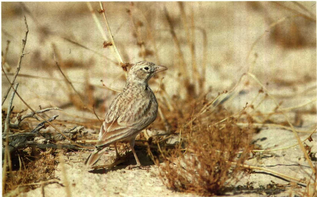
4 Dunn's Lark / Dunns Leeuwerik Eremalauda dunnii , Arava, Israel, November 1988