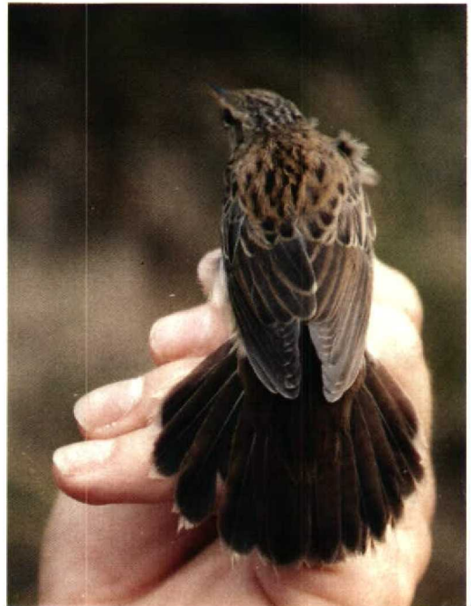
7-8 Siberische Sprinkhaanzanger / Pallas's Grasshopper Warbler Locustella certhiola , Castricum, Noordholland, 5 oktober 1991 (Henk-Jan Udding)

grond van de beschrijving en de foto's is deze ringvangst door de Commissie Dwaalgasten Nederlandse Avifauna (CDNA) aanvaard als het eerste geval van de Siberische Sprinkhaanzanger voor Nederland (van den Berg et al 1993).