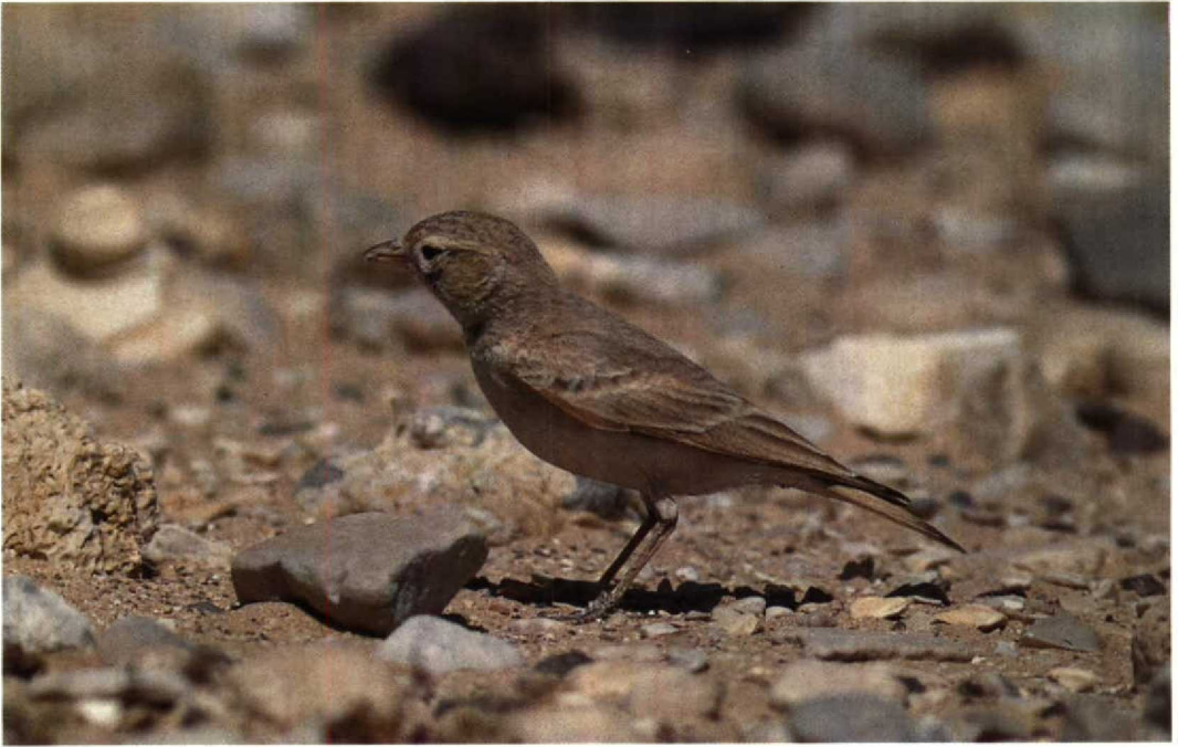
1 Bar-tailed Desert Lark / Rosse Woestijnleeuwerik Ammomanes cincturus , Eilat, Israel, March 1990