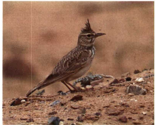
13 Thekla Lark / Theklaleeuwrik Galerida theklae showing compact proportions, Oued Sous, Morocco, January 1987 (Magnus Ullman) 14 Crested Lark / Kuifleeuwrik Galerida cristata showing long and slightly down-curved bill, long crest and elongated build; primary projection on this bird obvious enough to aid identification. Tamerza, Tunisia, April 1989 (Magnus Ullman)

almost a straight general appearance. In many Thekla Larks, however, the lower mandible is straight or so slightly upturned that it will be of no use in the field. This subtle difference in bill structure is partly due to the difference in bill length.