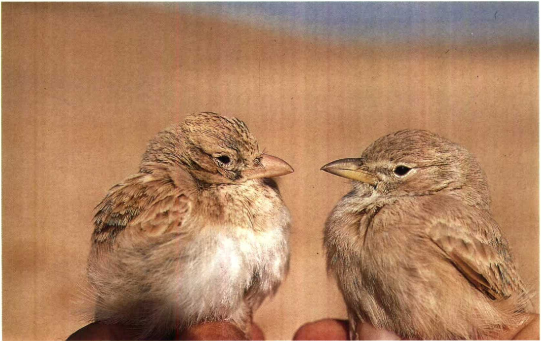
3 Dunn's Lark / Dunns Leeuwerik Eremalauda dunnii (left) and Desert Lark / Woestijnleeuwerik Ammomanes deserti , Israel, winter of 1988/89 ( Hadoram Shirihai )