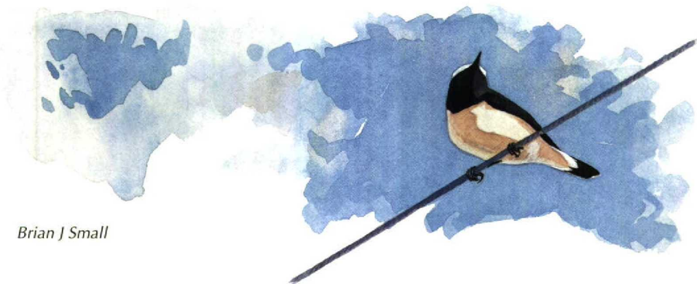
Brian J Small

T he taxonomic status of Cyprus Pied Wheatear Oenanthe cypriaca remains unclear. In the past it has usually been regarded as a subspecies of Pied Wheatear O. pleschanka but more recently it has often been given specific status. Christensen (1972) and Sluys & van den Berg (1982), who examined plumages, behaviour, food, moult and biometry, differentiate it from Pied Wheatear and the latter authors argue for specific status on the basis of these criteria, a view followed by Svensson (1992). Cramp (1988) and Keith et al (1992), however, treat it as a subspecies, with the latter stating that the differences in biometrics, plumage and song between Pied Wheatear and Cyprus Pied Wheatear are no greater than those sometimes shown by races of other species. In this article both taxa are treated as separate species.