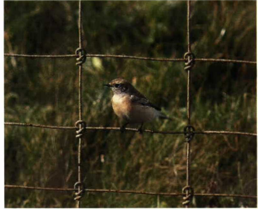
162-165 Bonte Tapuit / Pied Wheatear Oenanthe pleschanka , eerste-winter mannetje, Petten, Noordholland, 26 oktober 1992 (Arnaud B van den Berg)

voornamelijk zichtbaar achter oog. Behalve iets donkerdere bruine oorstreek nauwelijks tekening op kop, waardoor smalle lichte oogring opvallend. Kin en keel vuilwit, lichter dan oorstreek en borst, maar nauwelijks contrasterend en vaag begrensd. Bij opwaaien van keelveren soms bruingrijze veerbases te zien.