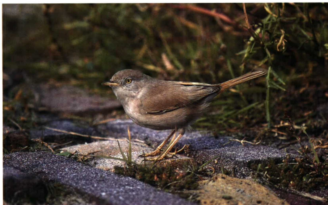
184 Woestijngrasmus / Desert Warbler Sylvia nana , Zandvoort, Noordholland, 8 oktober 1994 (Marten van Dijl)