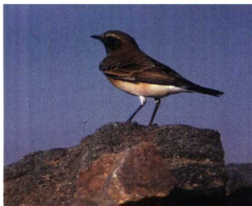
136 Pied Wheatear / Bonte Tapuit Oenanthe pleschanka , male, Cape Kaliakra, Bulgaria, 15 May 1994 (Leo J R Boon) 137 Cyprus Pied Wheatear / Cyprustapuit Oenanthe cypriaca , male, Akyatan Gölü, Adana, Turkey, 25 March 1987 (Arnoud B van den Berg) 138 Pied Wheatear / Bonte Tapuit Oenanthe pleschanka , first-summer male, Eilat, Israel, 1 April 1993 (Leo J R Boon) 139 Pied Wheatear / Bonte Tapuit Oenanthe pleschanka , first-summer male, Eilat, Israel, 1 April 1993 (Leo J R Boon) 140 Cyprus Pied Wheatear / Cyprustapuit Oenanthe cypriaca , first winter, Abu Simbel, Egypt, 31 January 1993 (Leo J R Boon) 141 Cyprus Pied Wheatear / Cyprustapuit Oenanthe cypriaca , first-winter male, Eilat, Israel, 6 October 1992 (Leo J R Boon)