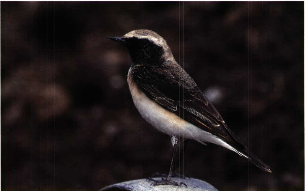
143 Pied Wheatear / Bonte Tapuit Oenanthe pleschanka , first-summer male, Eilat, Israel, 1 April 1993. Same bird as in plate 139 (Leo J R Boon)