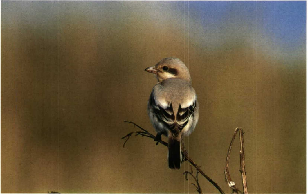
184 Steppeklapekster / Southern Grey Shrike Lanius meridionalis pallidirostris , De Cocksdorp, Texel, Noordholland, 22 september 1994

stijngrasmus werd in de loop van de zaterdagochtend ontdekt door Adri Remeus op de dijk langs de boulevard van Scheveningen, Zuidholland. De vogel bevond zich in lage begroeiing op de dijk en was absurd tam; hij kroop soms letterlijk over de voeten van de en masse toegestroomde waarnemers. Het relatief donkere verenkleed duidde (zoals te verwachten in onze contrëien) op de oostelijke ondersoort S n nana .