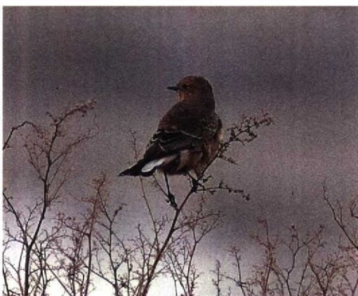
169 Bonte Tapuit / Pied Wheatear Oenanthe pleschanka , vermoedelijk eerste-winter vrouwtje, Katwijk, Zuidholland, 3 november 1992 (Arnoud B van den Berg)

De broedgebieden van de Bonte Tapuit liggen langs de kusten van de Zwarte Zee in Roemenië en Bulgarijë oostelijk tot voorbij het Baikalmeer in Aziatisch Rusland, en zuidelijk tot Afghanistan. De overwinteringsgebieden liggen in Oosten-Noordoostafrika, van Egypte tot in Kenya (Cramp 1988). In Noord- en Noordwesteuropa wordt de Bonte Tapuit vrijwel jaarlijks als dwaalgast vastgesteld (Lewington et al 1991). De meeste gevallen komen uit Groot-Brittannië en Ierland, 28 tot en met 1992 (Rogers & Rarities Committee 1993). Het betreft voor het overgrote deel najaarsgevallen. De meeste zijn vrij laat in het najaar, vooral rond eind oktober.