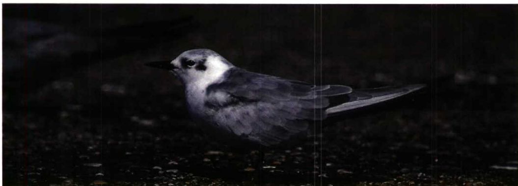
176 Kleine Zilverreigers / Little Egret Egretta garzetta , Zonnemaire, Zeeland, augustus 1994 ( Marten van Dijk ) 177 Zwarte Zeekoet / Black Guillemot Cepphus grylle , juveniel, IJmuiden, Noordholland, 25 augustus 1994 ( Arnoud B van den Berg ) 178 Blonde Ruiters / Buff-breasted Sandpiper Tryngites subruficollis , adult, Julianadorp, Noordholland, 3 september 1994 ( René van Rossum ) 179 Bonapartes Strandloper / White-rumped Sandpiper Calidris fuscicollis , adult, Holwerd, Friesland, 19 augustus 1994 ( Sascha Rösner ) 180 Witvleugelstern / White-wing- ed Black Tern Chlidonias leucopterus , Dashorstdijk, Flevoland, augustus 1994 ( Karel A Mauer )