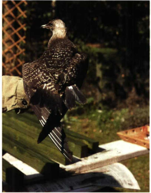
171-172 Kleinste Jager / Long-tailed Skua Stercorarius longicaudus , (gevonden te Lemselo, Overijssel, 16 september 1993), Enschede, Overijssel, 19 september 1993