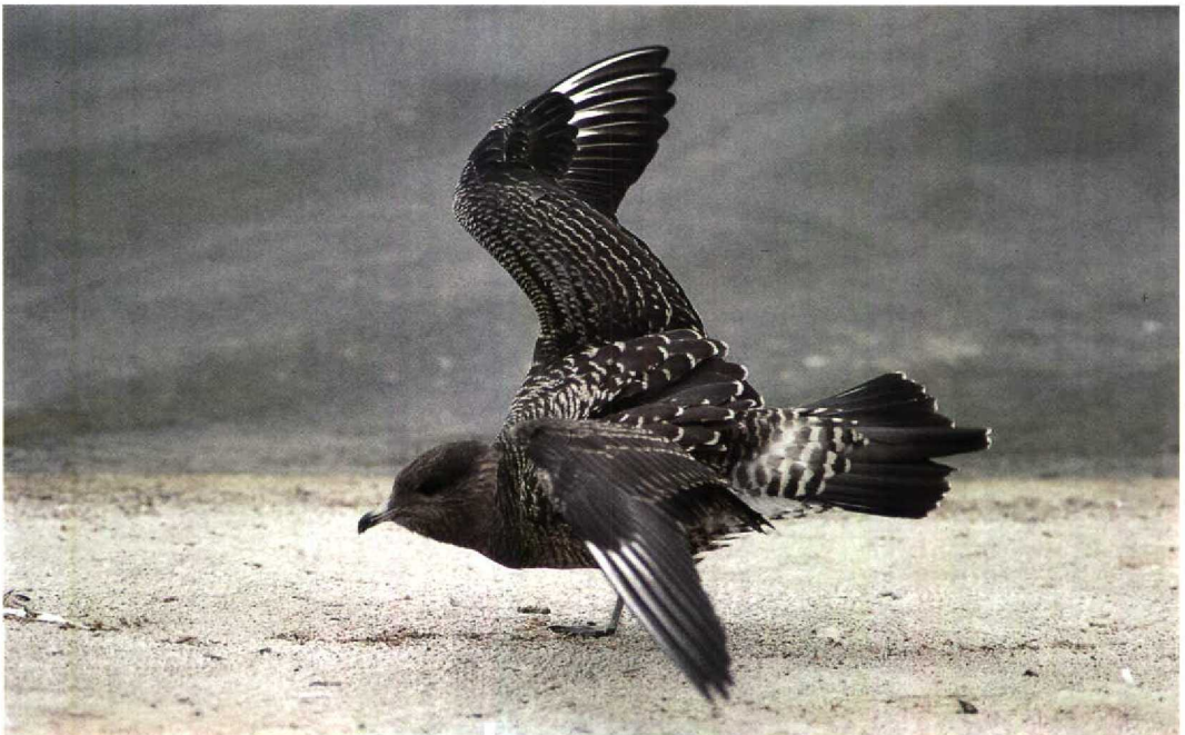
173 Kleinste Jager / Long-tailed Skua Stercorarius longicaudus , King George V Reservoir, Greater London, Engeland, september 1993