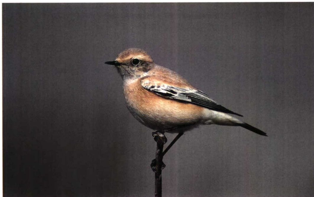
183 Woestijntapuit / Desert Wheatear Oenanthe deserti , Zandvoort, Noordholland, 9 oktober 1994