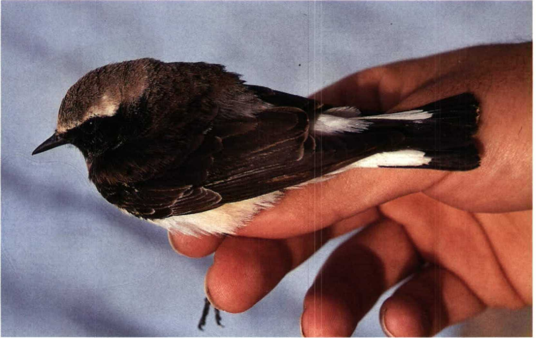
142 Pied Wheatear / Bonte Tapuit Oenanthe pleschanka , first-summer male, Eilat, Israel, 31 March 1993