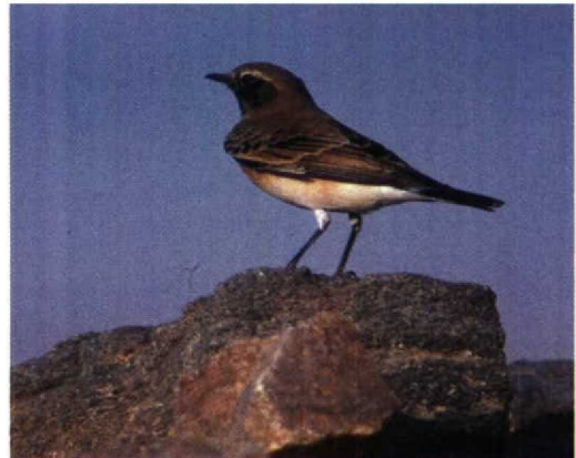
136 Pied Wheatear / Bonte Tapuit Oenanthe pleschanka , male, Cape Kaliakra, Bulgaria, 15 May 1994 (Leo J R Boon) 137 Cyprus Pied Wheatear / Cyprustapuit Oenanthe cypriaca , male, Akyatan Gölü, Adana, Turkey, 25 March 1987 (Arnoud B van den Berg) 138 Pied Wheatear / Bonte Tapuit Oenanthe pleschanka , first-summer male, Eilat, Israel, 1 April 1993 (Leo J R Boon) 139 Pied Wheatear / Bonte Tapuit Oenanthe pleschanka , first-summer male, Eilat, Israel, 1 April 1993 (Leo J R Boon) 140 Cyprus Pied Wheatear / Cyprustapuit Oenanthe cypriaca , first winter, Abu Simbel, Egypt, 31 January 1993 (Leo J R Boon) 141 Cyprus Pied Wheatear / Cyprustapuit Oenanthe cypriaca , first-winter male, Eilat, Israel, 6 October 1992 (Leo J R Boon)