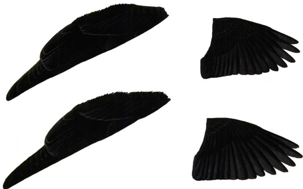
FIGURE 3 Closed and open wings of adult summer males Cyprus Pied Wheatear / Cyprustapuit Oenanthe cypriaca (upper) and Pied Wheatear / Bonte Tapuit Oenanthe pleschanka (lower) (Brian J Small). Note differences in primary extension and wing shape

retaining some brown fringes on mantle feathers of first-winter plumage into summer, and sometimes darker on crown.