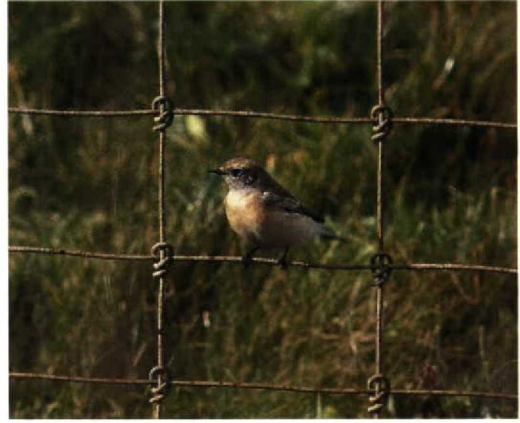
162-165 Bonte Tapuit / Pied Wheatear Oenanthe pleschanka , eerste-winter mannetje, Petten, Noordholland, 26 oktober 1992

voornamelijk zichtbaar achter oog. Behalve iets donkerdere bruine oorstreek nauwelijks tekening op kop, waardoor smalle lichte oogring opvallend. Kin en keel vuilwit, lichter dan oorstreek en borst, maar nauwelijks contrasterend en vaag begrensd. Bij opwaaien van keelveren soms bruingrijze veerbases te zien.