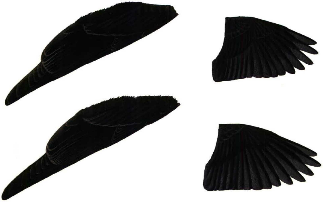
FIGURE 3 Closed and open wings of adult summer males Cyprus Pied Wheatear / Cyprustapuit Oenanthe cyprica (upper) and Pied Wheatear / Bonte Tapuit Oenanthe pleschanka (lower) (Brian J Small). Note differences in primary extension and wing shape

retaining some brown fringes on mantle feathers of first-winter plumage into summer, and sometimes darker on crown.