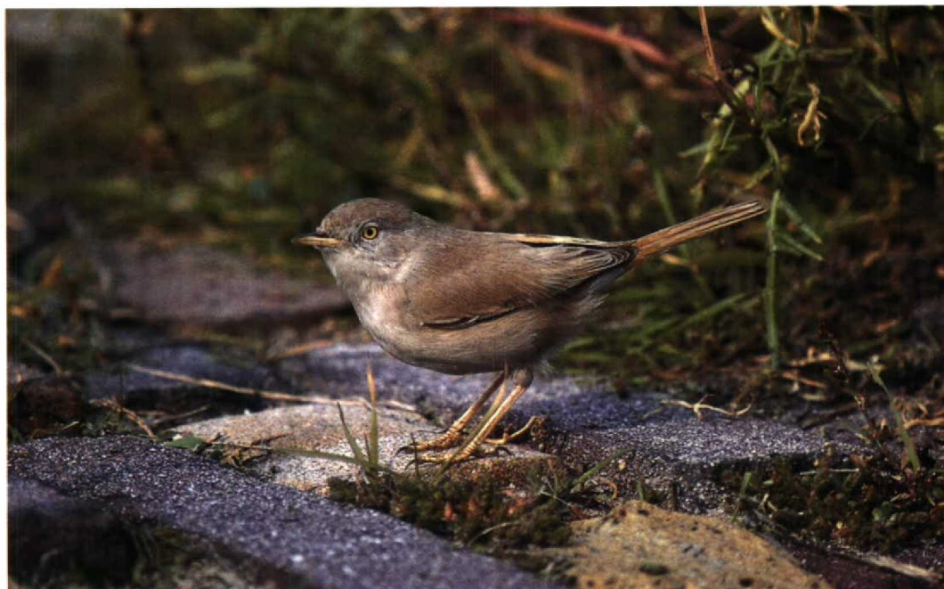
184 Woestijngrasmus / Desert Warbler Sylvia nana , Zandvoort, Noordholland, 8 oktober 1994 (Marten van Dijl)