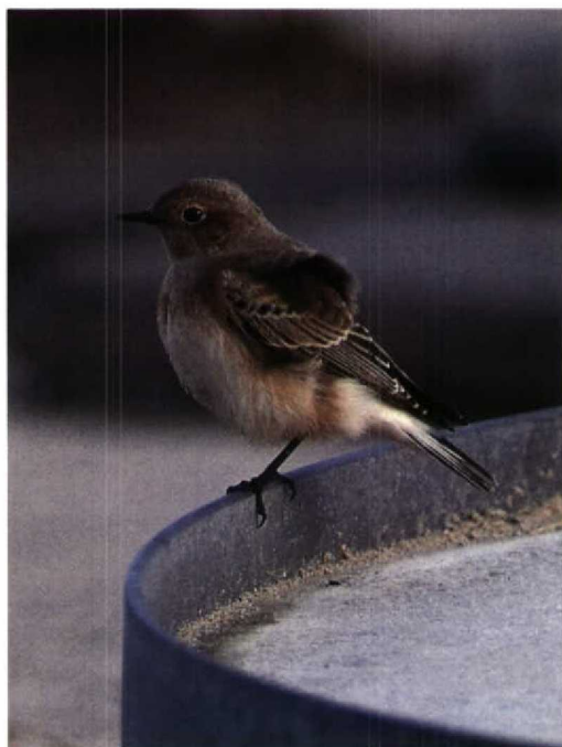
166-167 Bonte Tapuit / Pied Wheatear Oenanthe pleschanka , vermoedelijk eerste-winter vrouwtje, Katwijk, Zuidholland, 3 november 1992