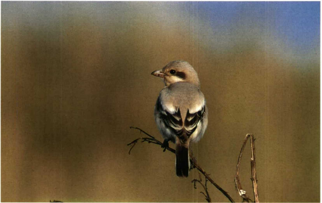
184 Steppeklapekster / Southern Grey Shrike Lanius meridionalis pallidirostris , De Cocksdorp, Texel, Noordholland, 22 september 1994 (Arnoud B van den Berg)

stijngrasmus werd in de loop van de zaterdagochtend ontdekt door Adri Remeus op de dijk langs de boulevard van Scheveningen, Zuidholland. De vogel bevond zich in lage begroeiing op de dijk en was absurd tam; hij kroop soms letterlijk over de voeten van de en masse toegestroomde waarnemers. Het relatief donkere verenkleed duidde (zoals te verwachten in onze contrëien) op de oostelijke ondersoort S n nana .