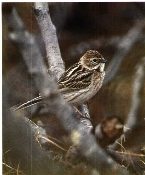
110 Pallas's Reed Bunting / Pallas' Rietgors Emberiza pallasi , female, Novaya river, Taimyr, Russia, July 1991

Per Alström (in litt) has commented as follows: 'Since the colour of the lower mandible of male Pallas's Reed Bunting changes from pale pinkish in the non-breeding season to blackish in the breeding season (though in some individuals it remains pinkish), it seems possible that some females also get an all dark lower mandible in summer. I have not seen any females with all black lower mandibles, though I have seen many in late spring and summer with the lower edge of the lower