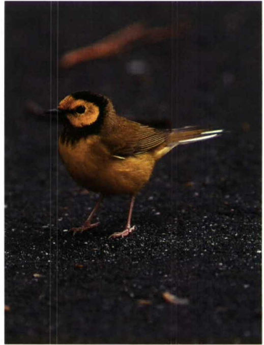
109 Monnikszanger / Hooded Warbler Wilsonia citrina, Belleplain, New Jersey, USA, 8 mei 1994