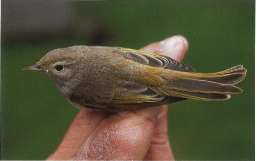
103 Western Bonelli's Warbler / Westelijke Bergfluitier Phylloscopus bonelli bonelli , Texel, Noordholland, 8 October 1992 (Arnoud B van den Berg)