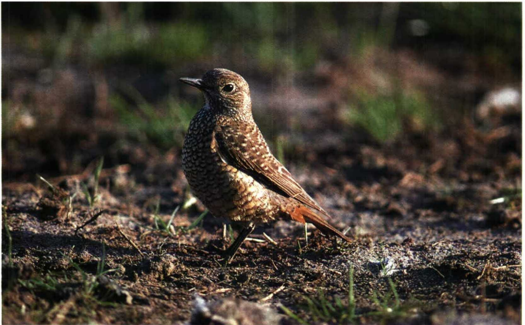
112 Rock Thrush / Rode Rotslijster Monticola saxatilis , Noordburen, Noordholland, Netherlands, 13 May 1994 (René van Rossum)