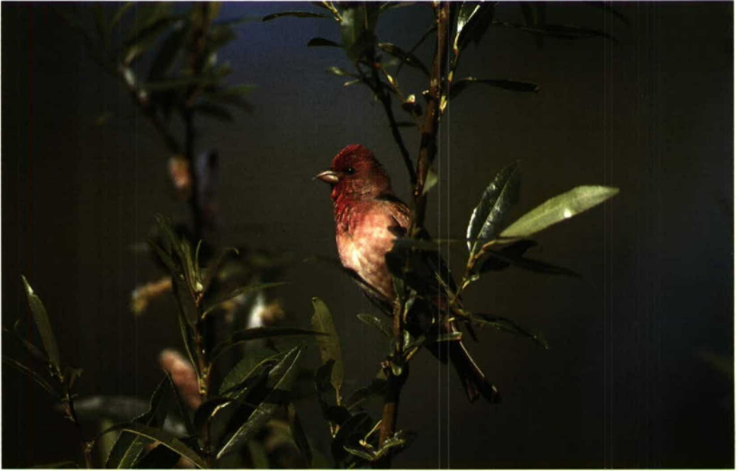
130 Roodmus / Scarlet Rosefinch Carpodacus erythrinus , Lepelaarsplassen, Flevoland, juni 1994 (Peter van Rij)