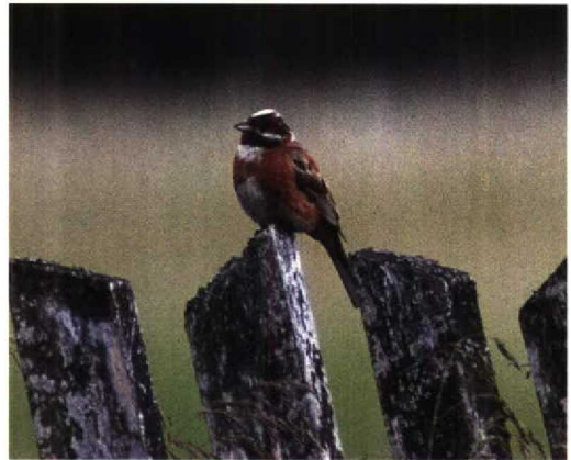
117 Citrine Wagtail / Citroenkwikstaart Motacilla citreola , showing characters of M c werae , Northeim, Niedersachsen, Germany, 26 April 1994 ( Felix Heintzenberg ) 118 Rock Thrush / Rode Rotslijster Monticola saxatilis , Helgoland, Schleswig-Holstein, Germany, 3 May 1994 ( Jochen Dierschke ) 119 Mongolian Finch / Mongoolse Woestijnvink Bucanetes mongolicus , Ishakpasa, Sarayi, Turkey, 29 May 1994 ( Leo J R Boon ) 120 Pine Bunting / Witkopgors Emberiza leucocephalos , Biebrza, Poland, 18 June 1994 ( Carl Derks )

Helgoland on 16 August 1982 has not been accepted and probably concerned another species (cf Dutch Birding 4: 97-98, 1982). The first Mugimaki Flycatcher Ficedula mugimaki for the WP in Humberside on 16-17 November 1991 has also been placed in 'Category D1'.