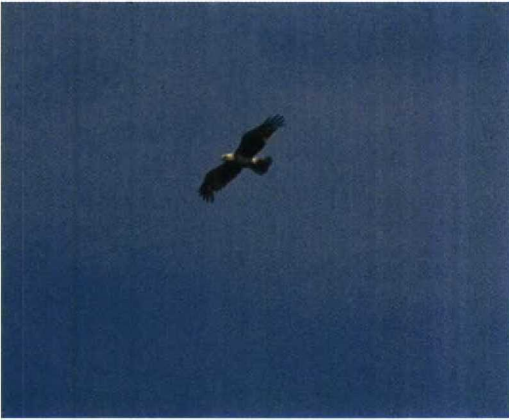
132 Slangearend / Short-toed Eagle Circaetus gallicus , Brecht-Wuustwezel, Antwerpen, juni 1994 (Patrick Beirens)