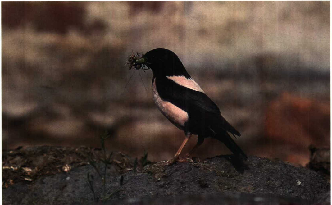
116 Rosy Starling / Roze Spreeuw Sturnus roseus , Hortobágy, Hungary, 10 July 1994