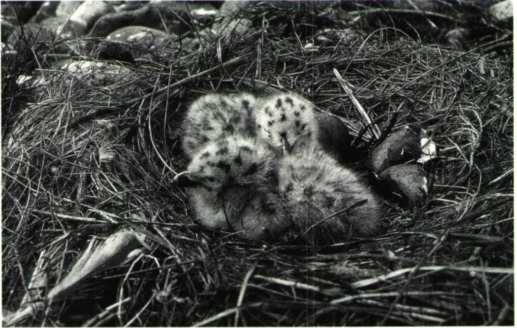
135 Grote Mantelmeeuw / Great Black-backed Gull Larus marinus , nest, Veerse Meer, Zeeland, mei 1994

Markiezaat, Zeeland/Noordbrabant, leverde niets op. Omdat de voorgaande weken regelmatig Kleine Zilverreigers aanwezig waren in het Verdronken Land van Saeftinge, Zeeuws-Vlaanderen (maximaal 24!), vormde de ene vogel die op 19 augustus door Floor Arts en Rob Strucker werd gezien bijna een teleurstelling. Wel troffen zij deze dag twee exemplaren aan op het Paulinaschor, Zeeuws-Vlaanderen. Er kan derhalve worden aangenomen dat er half augustus 1994 minimaal 30 Kleine Zilverreigers aanwezig waren in het Deltagebied, een aantal dat nog niet eerder in Nederland werd vastgesteld. PETER L MEININGER