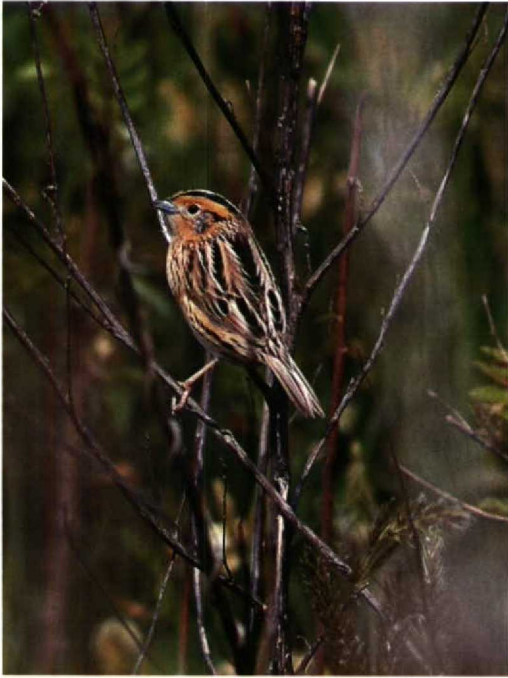
108 Leconte's Gors / LeConte's Sparrow Ammodramus leconteii , Higbee Beach, Cape May, New Jersey, USA, 9 mei 1994 (Arnoud B van den Berg)