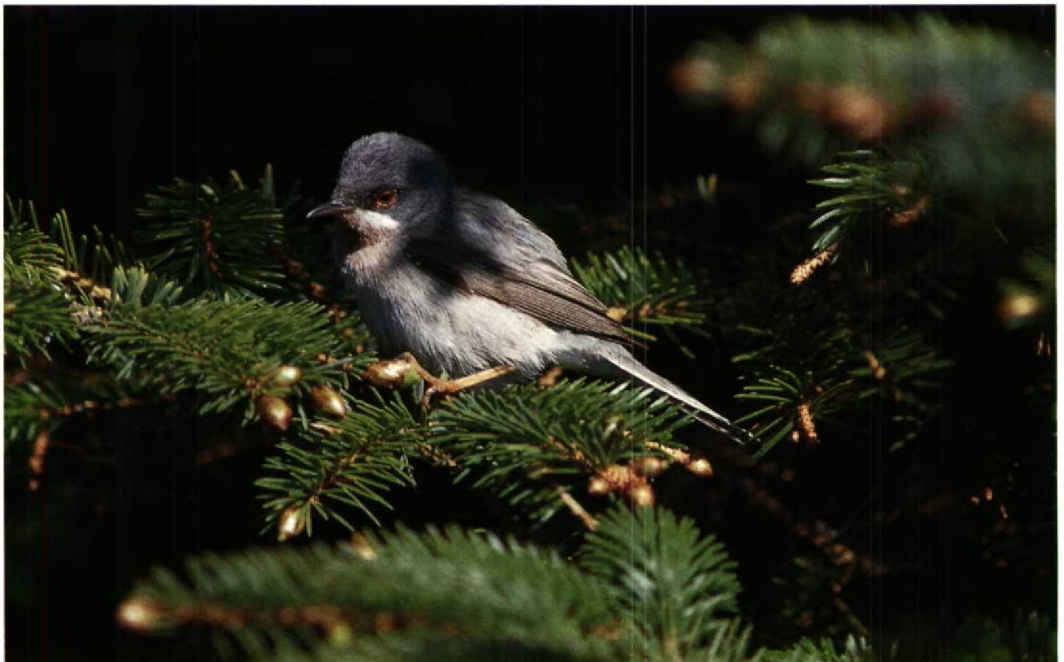
114 Subalpine Warbler / Baardgrasmus Sylvia cantillans , Utsira, Rogaland, Norway, May 1994 (Håkon Heggland)