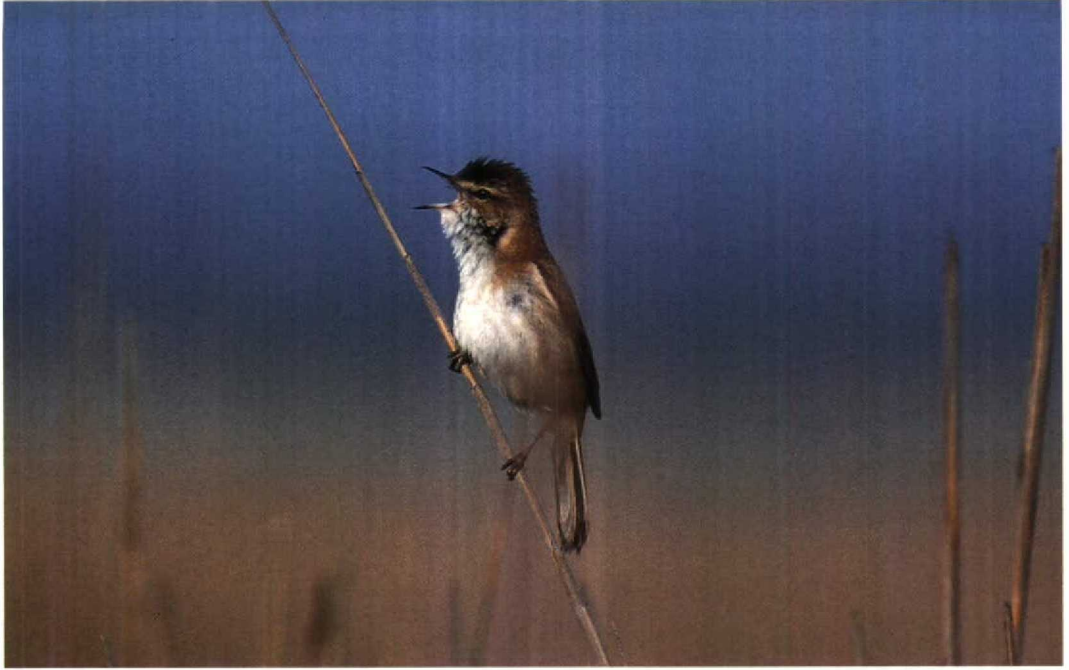
115 Paddyfield Warbler / Veldrietzanger Acrocephalus agricola , Lake Durankulak, Bulgaria, 15 May 1994 (Leo J R Boon)