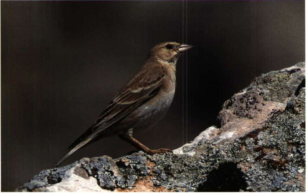
113 Pale Rock Sparrow / Bleke Rotsmus Carpospiza brachydactyla , Isikli, Turkey, 23 May 1994