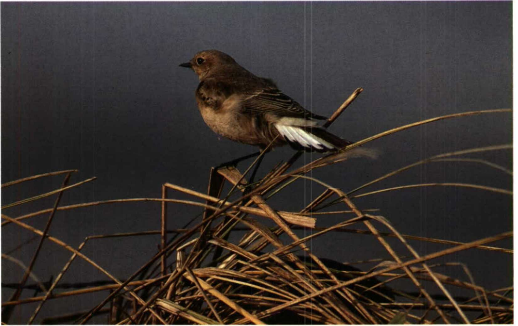
101 Pied Wheatear / Bonte Tapuit Oenanthe pleschanka , first-winter female, Katwijk, Zuidholland, November 1992