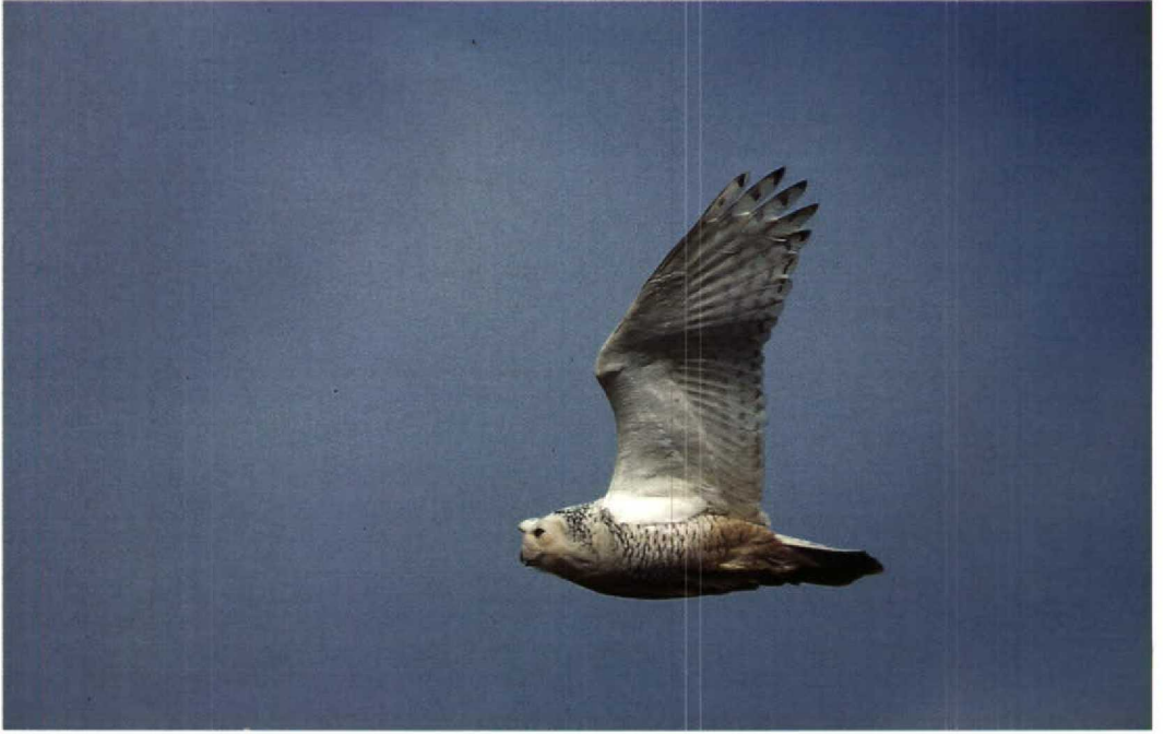
94 Snowy Owl / Sneeuwuil Nyctea scandiaca , Maasvlakte, Zuidholland, February 1992