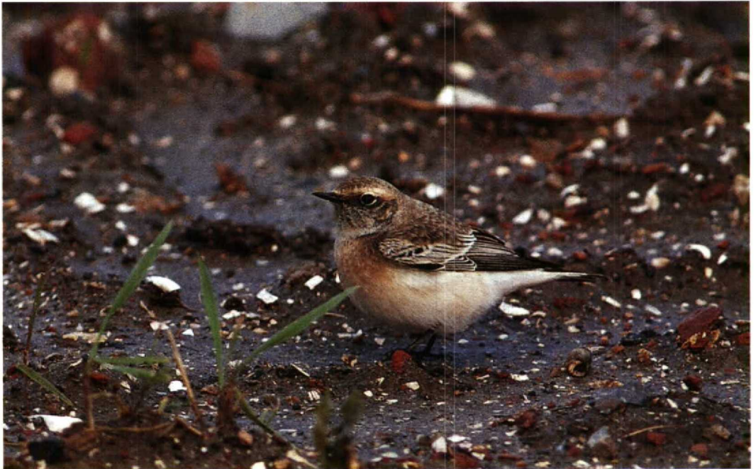
102 Pied Wheatear / Bonte Tapuit Oenanthe pleschanka , first-winter male, Petten, Noordholland, October 1992