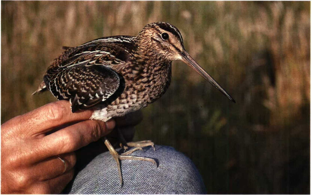
111 Great Snipe / Poelsnip Gallinago media , Zandvoort, Noordholland, 26 July 1994 (Arnoud B van den Berg; Vrs AW-duinen)