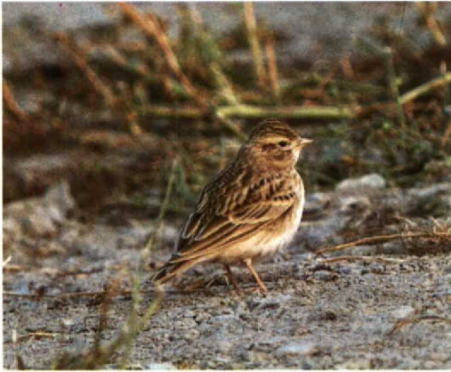
105 Short-toed Lark / Kortteenleeuwerik Calandrella brachydactyla , Eemshaven, Groningen, 29 September 1992