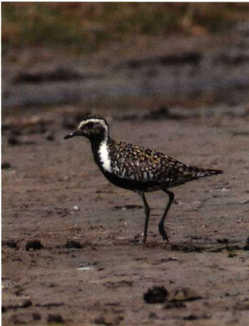
134 Aziatische Goudplevier / Pacific Golden Plover Pluvialis fulva , Bakkersdam, Petten, Noordholland, 24 juli 1994 (Arnoud B van den Berg)