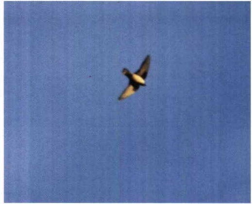
133 Rotszwaluw / Crag Martin Ptyonoprogne rupestris , Zandhoven, Antwerpen, mei 1994

van 22 tot 24 mei. Eén van de zware missers was de adult-zomer Bairds Strandloper Calidris bairdii die in de avond van 13 mei te Pecq-Warcoing, Hainaut, werd gemeld. Op 2 mei pleisterde kortstondig een Gestreepte Strandloper C. melanotos bij Uitkerke. De adulte Terekruiter Xenus cinereus in zomerkleed die van 13 tot 21 mei bij Semmerzake verbleef, was ons beter gezind. Een Grote Burgemeester Larus hyperboreus in eerste zomerkleed die op 14 mei te Heist, Westvlaanderen, en op 17 juni in de Voorhaven van Zeebrugge verbleef, was wellicht hetzelfde exemplaar dat reeds eerder aanwezig was. De enige Lachstern Gelochelidon nilotica vloog langs Bredene op 13 mei. Op 1 mei vlogen twee Reuzensterns Sterna caspia over Lier en trok bovendien diezelfde dag één exemplaar langs Sint-Agatha-Rode, Brabant. Een ietwat aberrante Dougalls Stern Sterna dougallii verbleef op 30 juni in de Voorhaven van Zeebrugge. Er werden Witwangsterns Chlidonias hybridus gezien in de Voorhaven van Zeebrugge op 7 mei; te Orroir, Hainaut (drie) op 14 en 15 mei; te Blokkersdijk van 16 tot 18 mei; en te Pomme-reoul-Hensies, Hainaut (twee) op 22 mei. De enige Witvleugelstern C. leucopterus werd op 23 mei ontdekt bij Péronnes, Hainaut.