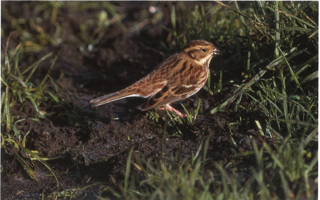
104 Rustic Bunting / Bosgors Emberiza rustica , Petten, Noordholland, 26 October 1992