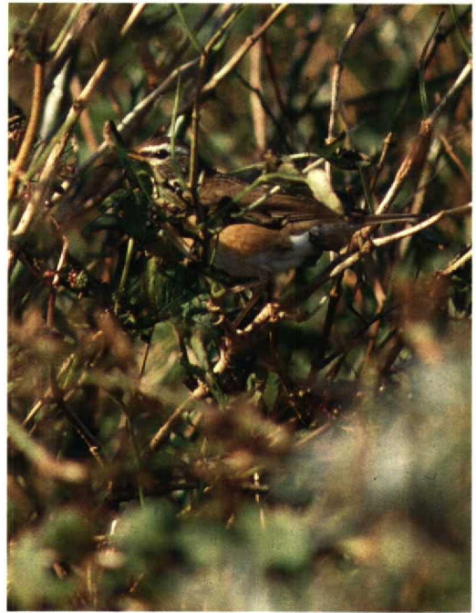
97 Eagle Owl / Oehoe Bubo bubo , Ermelo, Gelderland, May 1992 (Aart Smit) 98 Eyebrowed Thrush / Vale Lijster Turdus obscurus , Callantsoog, Noordholland, 18 October 1992 (Danny Ellinger) 99 Squacco Heron / Ralreiger Ardeola ralloides , Rammegors, Zeeland, June 1992 (Hans Gebuis) 100 Sociable Plover / Steppiekievit Chettusia gregaria , Ubbergen, Gelderland, August 1992 (Hans Gebuis)