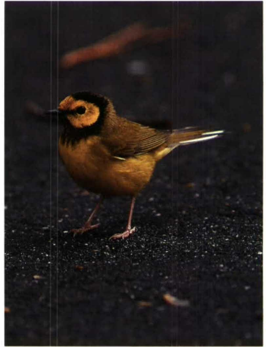
109 Monnikszanger / Hooded Warbler Wilsonia citrina, Belleplain, New Jersey, USA, 8 mei 1994