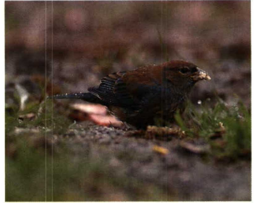
106 Indigo Bunting / Indigogors Passerina cyanea , Amsterdam, Noordholland, March 1989 (Hans Gebuis)

dered by the CDNA. The CDNA still awaits information on several trapped birds in this and previous years (cf van Dongen et al 1992, van den Berg et al 1993)