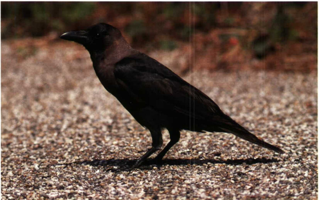
131 Huiskraai / House Crow Corvus splendens , Hoek van Holland, Zuidholland, 30 juni 1994 (Arnoud B van den Berg)