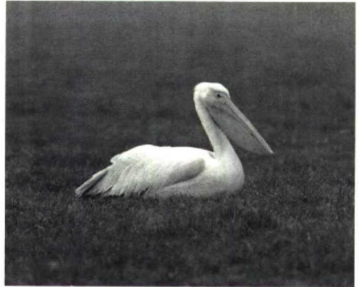
84 Roze Pelikaan / White Pelican Pelecanus onocrotalus , Havelte, Drenthe, november 1987

Op grond van bovenstaande gegevens lijkt het (nog steeds) zeer goed mogelijk dat incidenteel wilde Roze Pelikanen afdwalen naar Westeuropa. Gezien de sterk teruggelopen broedpopulatie is de kans op (met name groepjes) zwerfende vogels echter weliswaar aanzienlijk kleiner geworden maar daartegenover staat dat de toegenomen waarnemersintensiteit kan bijdragen aan een toename van het aantal meldingen. Hoewel ontsnapte vogels zeker verantwoordelijk kunnen zijn voor recente gevallen in Westeuropa, achten