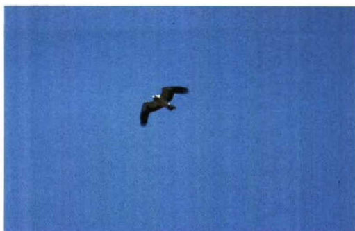
82 Dwergarend / Booted Eagle Hieraaetus pennatus , lichte vorm, Keersluisplas, Flevoland, 24 april 1993 (Hein Prinsen)

kwam DF tot de volgende reactie: 'Good to see the slides in original. My judgement is mainly based on slides 1, 2 and 4, which show most plumage details and it is: Booted Eagle! The shape of the bird is right for Booted, with longish and square-cut tail and rather short wings with ample tip. The coloration of the upperparts fits perfectly with Booted (upperwing and tail) and from below the pale inner primaries can be seen. Combining all the slides I think you can safely identify the bird as a Booted Eagle, despite the low quality of the slides. The plumage is OK for Booted and all the slides together show the shape of the bird reliably enough to rule out any similarly plumaged Buzzard or Honey Buzzard. In addition the observer has seen the white 'head-lights' at the wing bases, which can not be seen in the slides.'