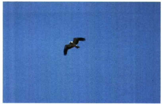
82 Dwergarend / Booted Eagle Hieraaetus pennatus , lichte vorm, Keersluisplas, Flevoland, 24 april 1993

kwam DF tot de volgende reactie: 'Good to see the slides in original. My judgement is mainly based on slides 1, 2 and 4, which show most plumage details and it is: Booted Eagle! The shape of the bird is right for Booted, with longish and square-cut tail and rather short wings with ample tip. The coloration of the upperparts fits perfectly with Booted (upperwing and tail) and from below the pale inner primaries can be seen. Combining all the slides I think you can safely identify the bird as a Booted Eagle, despite the low quality of the slides. The plumage is OK for Booted and all the slides together show the shape of the bird reliably enough to rule out any similarly plumaged Buzzard or Honey Buzzard. In addition the observer has seen the white 'head-lights' at the wing bases, which can not be seen in the slides.'