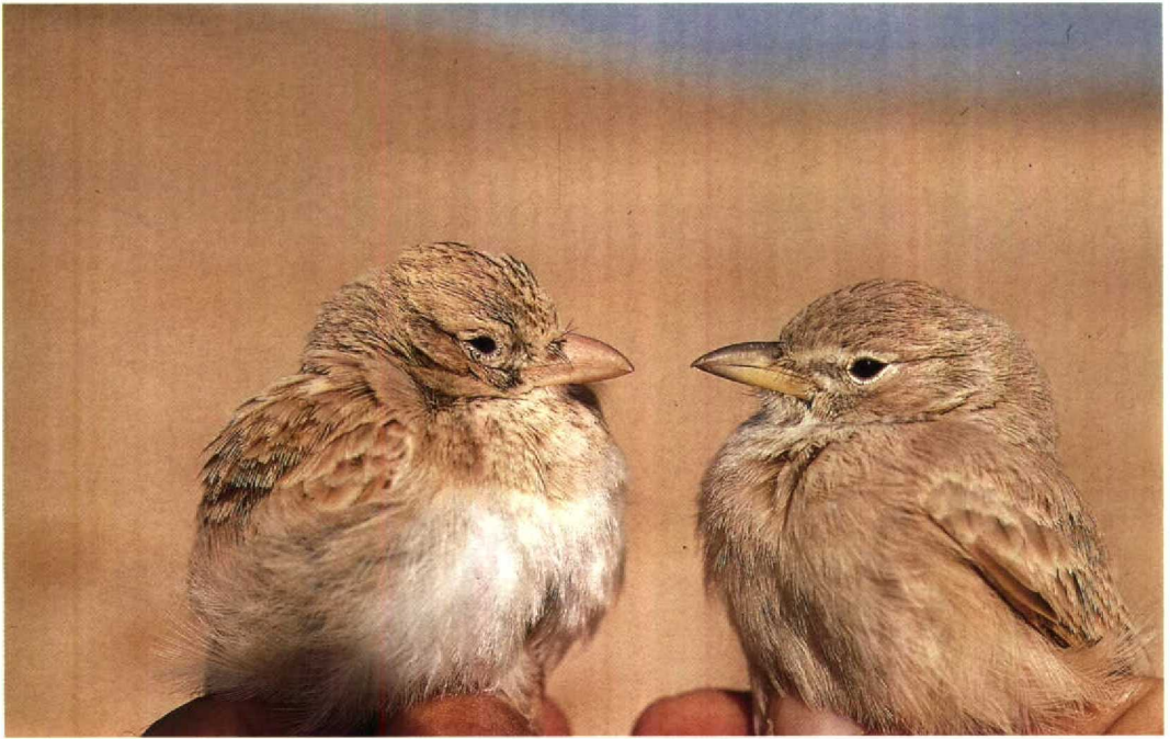
3 Dunn's Lark / Dunns Leeuwerik Eremalauda dunnii (left) and Desert Lark / Woestijnleeuwerik Ammomanes deserti , Israel, winter of 1988/89 ( Hadoram Shirihai )