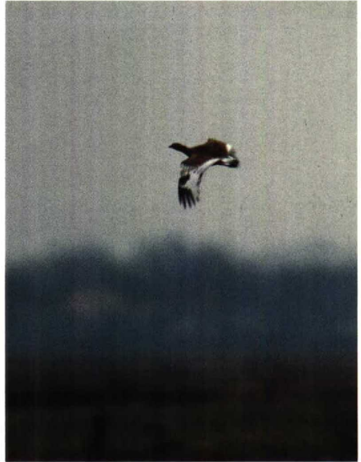
25 Zeearend / White-tailed Eagle Haliaeetus albicilla , Lauwersmeer, Friesland, 31 december 1993 26 Kleine Trap / Little Bustard Tetrax tetrax , Grijskerke, Zeeland, december 1993 27 Pestvogel / Bohemian Waxwing Bombycilla garrulus , Zeewolde, Flevoland, december 1993