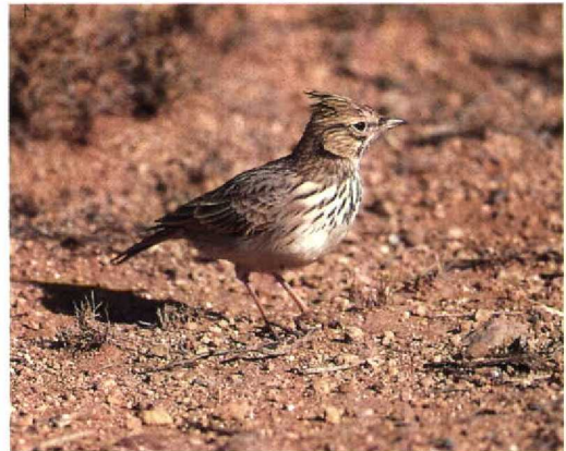
12 Thekla Lark / Theklaleeuwerik Galerida theklae showing short bill and crest, Zeida, Morocco, November 1990 (Magnus Ullman)

Lark are longer than in European birds. Birds with intermediate bill length occur and may be difficult to identify. Occasionally, even in the field, the shape of the lower mandible is of help. In Crested Lark, the lower mandible is usually straight; the general impression is of a down-curved bill. In Thekla Lark, the lower mandible may be slightly upturned, thus giving the bill