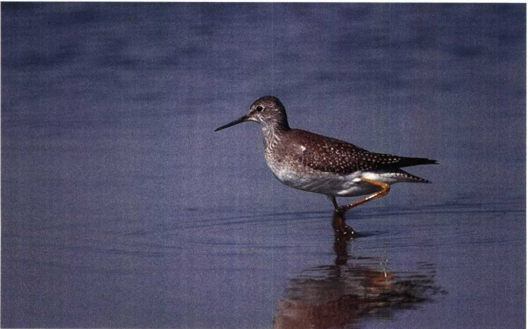
41 Lesser Yellowlegs / Kleine Geelpootruiter Tringa flavipes , Ontario, Canada, August 1988 (Colin Bradshaw)