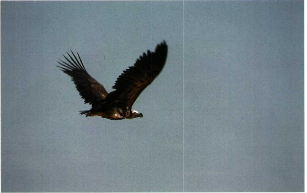
44 Lappet-faced Vulture / Oorgier Torgos tracheliotus , Abu Simbel, Egypt, 31 January 1993 (Leo J R Boon)