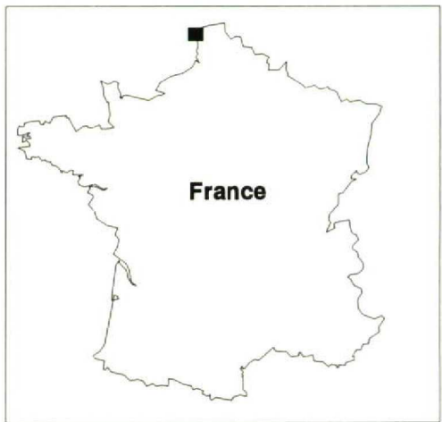
FIGURE 1 Le Portel and surroundings, Pas-de-Calais, France, with some localities mentioned in text