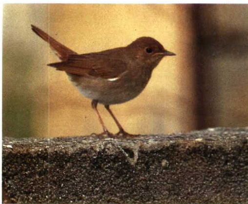
25 Wood Thrush / Amerikaanse Boslijster Hylocichla mustelina , Point Pelee, Ontario, Canada, August 1988 (Colin Bradshaw) 26 Grey-cheeked Thrush / Grijswangdwerglijster Catharus minimus , St Mary's, Scilly, October 1991 (Colin Bradshaw) 27 Veery / Veery Catharus fuscescens , Point Pelee, Ontario, Canada, August 1988 (Colin Bradshaw) 28 Swainson's Thrush / Dwerglijster Catharus ustulatus , Point Pelee, Ontario, Canada, August 1988 (Colin Bradshaw) 29 Hermit Thrush / Heremietlijster Catharus guttatus , Idaho, USA, September 1991 (René Pop) 30 Thrush Nightingale / Noordse Nachtegaal Luscinia luscinia , Karatas, Turkey, 19 April 1988 (Colin Bradshaw)