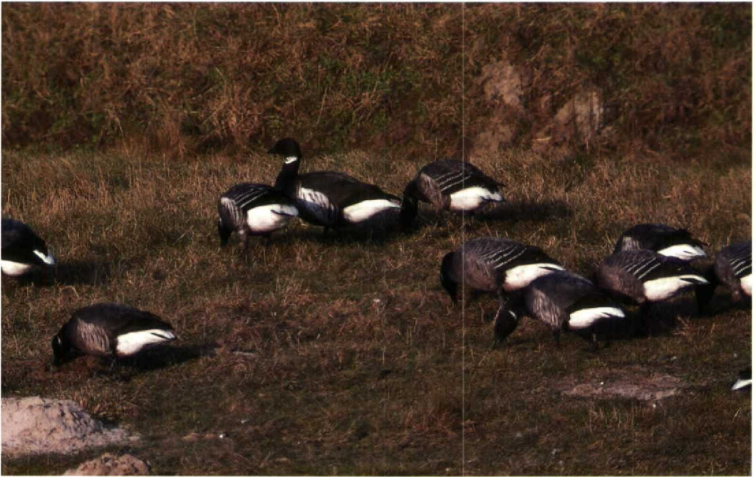
31-32 Gemengd paartje Rotgans Branta bernicla bernicla en Zwarte Rotgans B b nigricans met twee 'hybride' jongen Rotgans x Zwarte Rotgans (links en rechts van Zwarte Rotgans) / mixed pair Dark-bellied Brent Goose and Black Brant with two hybrid young Dark-bellied Brent x Black Brant (left and right of Black Brant), Grevelingendam, Zeeland, 22 januari 1992