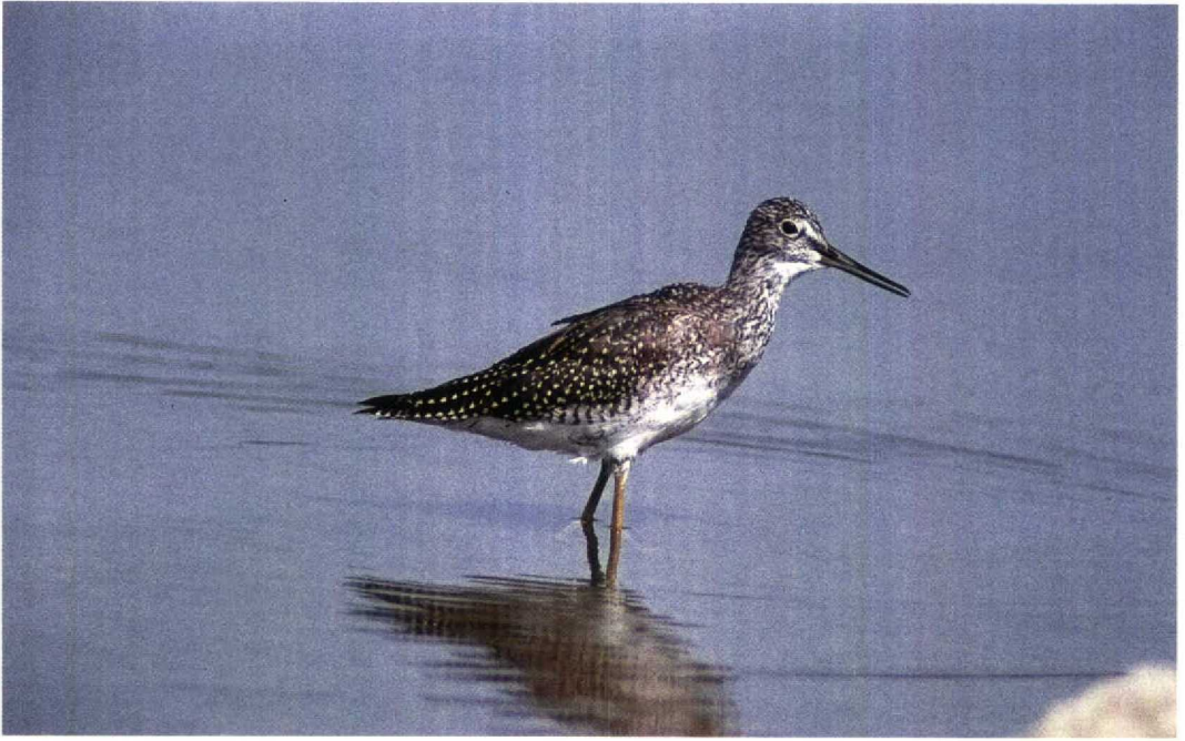
40 Greater Yellowlegs / Grote Geelpootruiter Tringa melanoleuca , Manitoba, Canada, August 1991