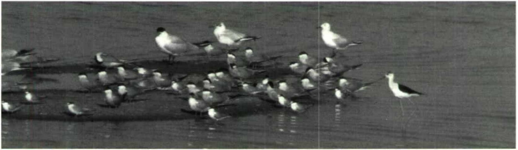
38 Brown-headed Gull / Bruinkopmeeuw Larus brunnicephalus , with Black-winged Stilt / Steltkluit Himantopus himantopus , Slender-billed Gull / Dunbekmeeuw L. genei , Caspian Tern / Reuzestern Sterna caspia , Little Terns / Dwergsterns S. albigrons and Common Terns / Visdieven S. hirundo , Lake Tudakul, near Bukhara, Uzbekistan, CIS, 30 May 1985

WING Forewing mid-grey, considered slightly darker than in Black-headed Gull. Dark barring on median, and large pale panel on greater upperwing-coverts. Secondaries with broad medium-brown bar. Outer (three?) primaries all-black, other primaries with white basal and black distal half. Primary-coverts mainly white. In flight, dark leading edge and trailing edges to primaries surrounding the white 'mid-hand' feathers forming distinctive white triangle bordered on two sides by black, and on inner aspect by grey.