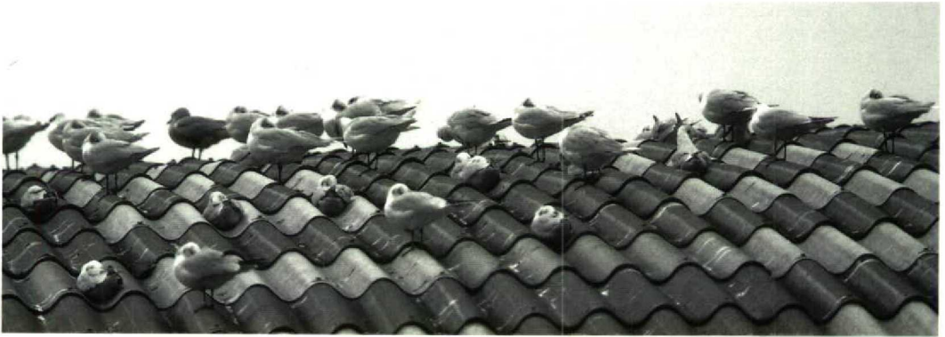
24 Mediterranean Gulls / Zwartkopmeeuwen Larus melanocephalus (part of exceptionally large roof-resting group of 34) including one individual colour-ringed (green C24) as first-winter on 27 December 1991 at Le Portel, Pas-de-Calais, France, with Black-headed Gulls / Kokmeeuwen L. ridibundus and one Kittiwake / Drieteenmeeuw Rissa tridactyla , Le Portel, 7 November 1992 (Arnoud B van den Berg)

Charente-Maritime, with numbers up to 600 (Milbled 1991). North of Bretagne, two other staging and wintering sites showed an increase in numbers in recent years: the western coast of Manche and the harbour of Antifer, Seine-Maritime, both with up to 50-100 birds (Gérard Debout in litt).