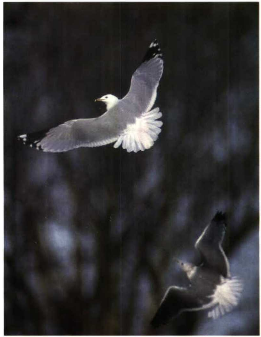
46 Striated Scops Owl / Gestreepte Dwergooruil Otus brucei , Eilat, Israel, 12 January 1993 (Leo J R Boon) 47 Ring-billed Gull / Ringsnavelmeeuw Larus delawarensis , Belfast, Northern Ireland, 21 March 1993 (René Pop) 48 Ring-billed Gull / Ringsnavelmeeuw Larus delawarensis , first-winter, Bergen, Hordaland, Norway, 29 January 1993 (Håkon Heggland)