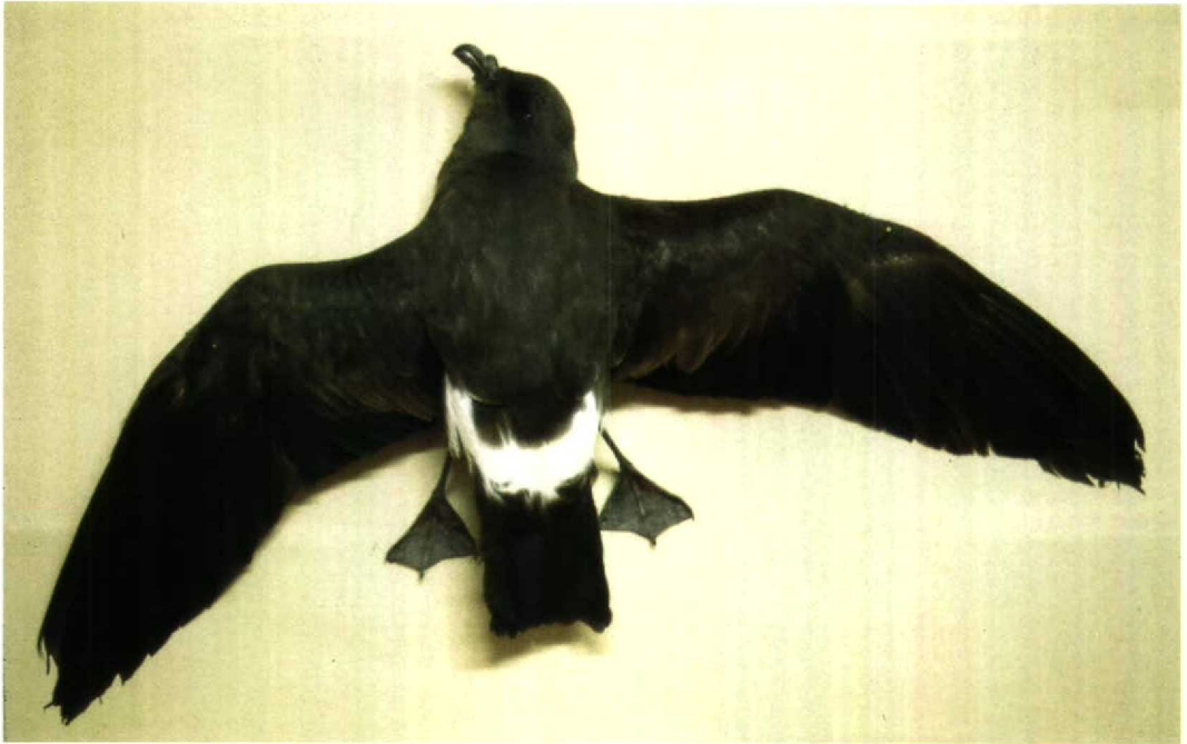
42 Madeiran Storm-petrel / Madeirastormvogeltje Oceanodroma castro , Suonenjoki, Finland, 19 January 1993 (Pentti Alaja) 43 Striated Heron / Mangroveveiger Butorides striatus , Eilat, Israel, 21 November 1992 (Leo J R Boon)