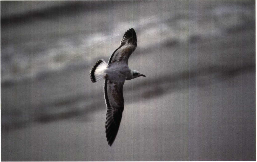
21 Mediterranean Gull / Zwartkopmeeuw Larus melanocephalus , juvenile moulting to first-winter, Le Portel, Pas-de-Calais, France, 12 September 1992 (Arnaud B van den Berg) 22 Mediterranean Gull / Zwartkopmeeuw Larus melanocephalus , colour-ringed (white 51E) as chick on 8 June 1992 at Slikken van de Heen (West), Zeeland, Netherlands, moult from juvenile to first-winter plumage nearly completed, Le Portel, Pas-de-Calais, France, 12 September 1992 (Arnaud B van den Berg)