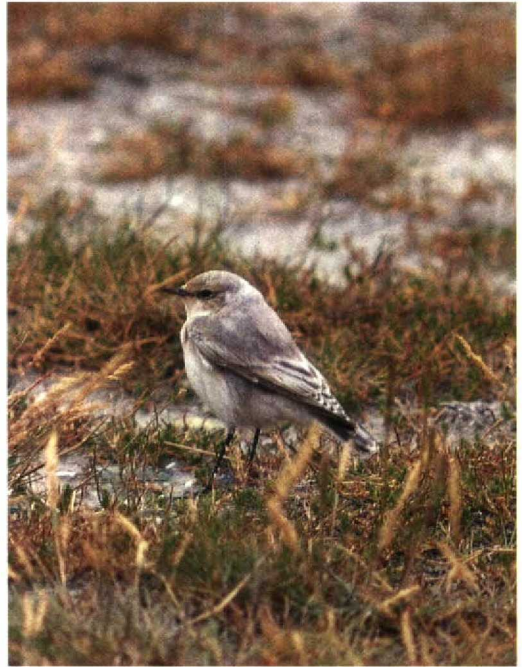
36 Tapuit / Northern Wheatear Oenanthe oenanthe , Schiermonnikoog, Friesland, 9 augustus 1991 (Leo / R Boon)

Edger van Boheemen, De Schans 44, 4223 NT Hoornaar, Nederland