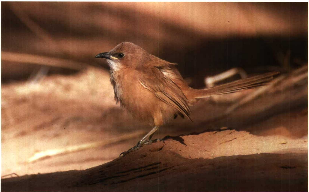
39 Fulvous Babbler / Bruingele Babbelaar Turdoides fulvus, Merzouga, Morocco, January 1991