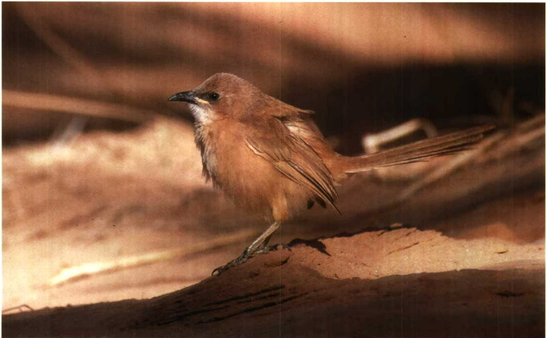
39 Fulvous Babbler / Bruingele Babbelaar Turdoides fulvus, Merzouga, Morocco, January 1991