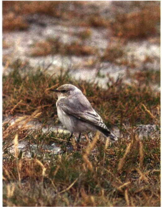
36 Tapuit / Northern Wheatear Oenanthe oenanthe, Schiermonnikoog, Friesland, 9 augustus 1991