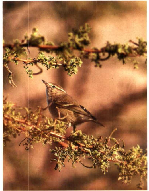
49 Cyprus Pied Wheatear / Cyprese Tapuit Oenanthe cyprica , Abu Simbel, Egypt, 31 January 1993 (Leo J R Boon) 50 Hume's Yellow-browed Warbler / Humes Bladkoning Phylloscopus humei , Eilat, Israel, 7 February 1993 (Leo J R Boon) 51 Sociable Plovers / Steppekieviten Chettusia gregaria , United Arab Emirates, January 1993 (Peter H Barthel)