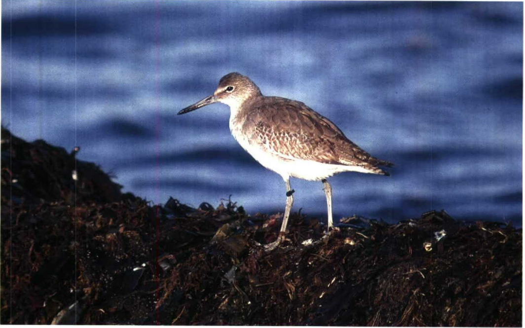
14 Willet / Willet Catoptrophorus semipalmatus , Mølen, Vestfold, Norway, October 1992 (Håkon Hegglund)