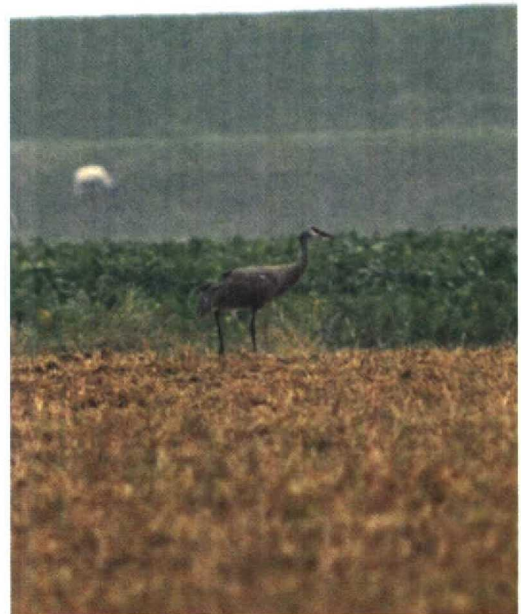
1 Canadese Kraanvogel / Sandhill Crane Grus canadensis , Paesens, Friesland, 29 september 1991 (Arnoud B van den Berg)