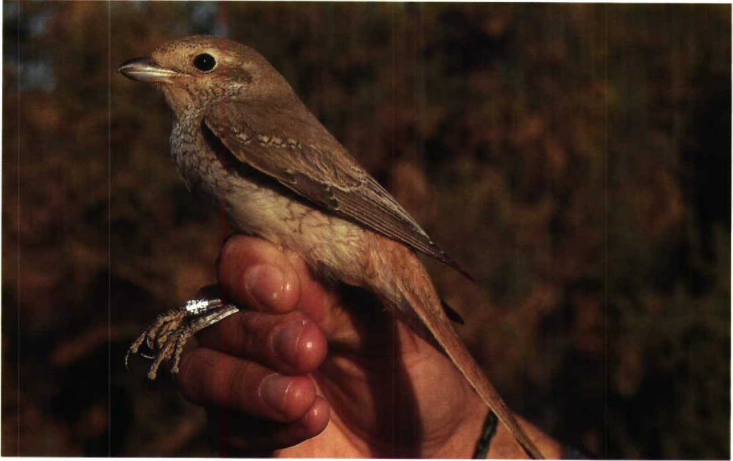
16 Isabelline Shrike / Izabelklauwier Lanius isabellinus , Eilat, Israel, November 1992 (Leo J R Boon)

Po on 21 November); the third Rufous-faced Warbler Abroscopus albogularis (the first since 1964) was at Ho Cheung from 10 January 1993.)