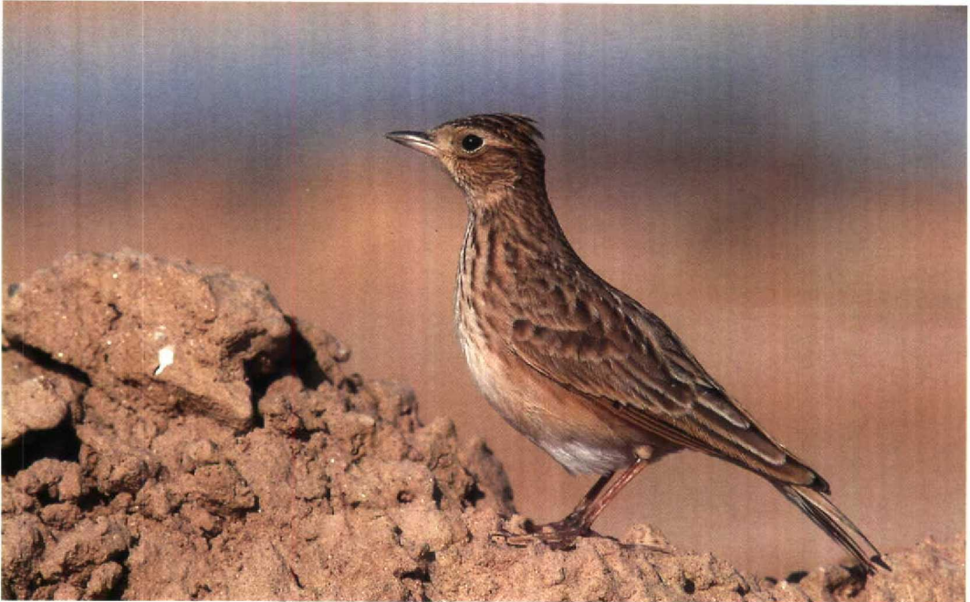
15 Oriental Lark / Kleine Veldleeuwerik Alauda gulgula , Eilat, Israel, November 1992