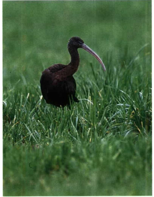
17 Dwerggans / Lesser White-fronted Goose Anser erythropus , Den Bommel, Zuidholland, 30 december 1992 (Arnoud B van den Berg) 18 Zwarte Ibis / Glossy Ibis Plegadis falcinellus , Kalkense Meersen, Oostvlaanderen, december 1992 (Frederik Willemyns) 19 Bonte Tapuit / Pied Wheatear Oenanthe pleschanka , Katwijk, Zuidholland, 4 november 1992 (René van Rossum)