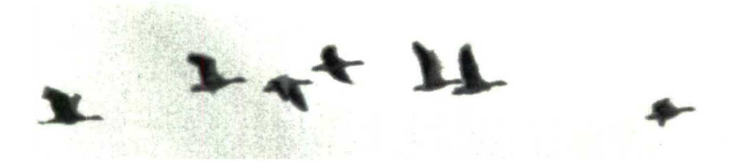
2 Canadese Kraanvogel / Sandhill Crane Grus canadensis met Grauwe Ganzen / Greylag Geese Anser anser , Paesens, Friesland, 29 september 1991