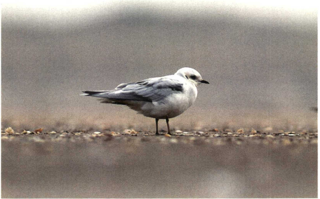
7 Ross' Meeuw / Ross's Gull Rhodostethia rosea , IJmuiden, Noordholland, 23 november 1992