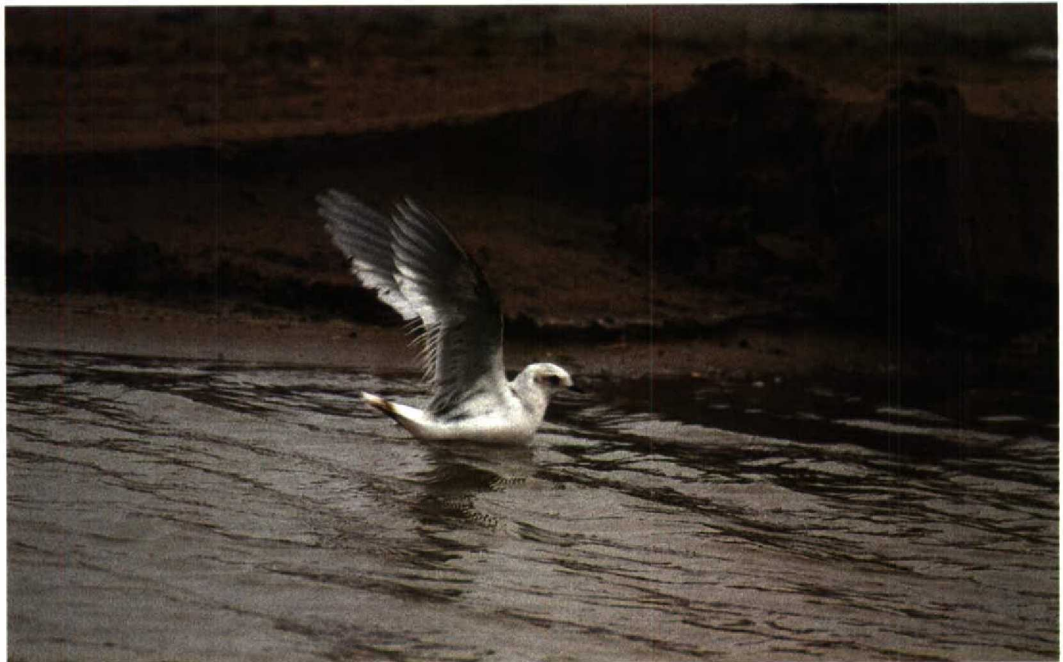
6 Ross' Meeuw / Ross's Gull Rhodostethia rosea , IJmuiden, Noordholland, 22 november 1992 (Rob ter Ellen)