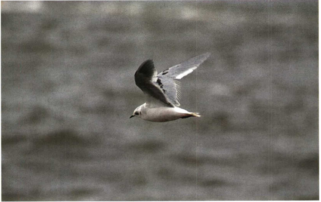
5 Ross' Meeuw / Ross's Gull Rhodostethia rosea , IJmuiden, Noordholland, 22 november 1992 (Arie Ouwerkerk)