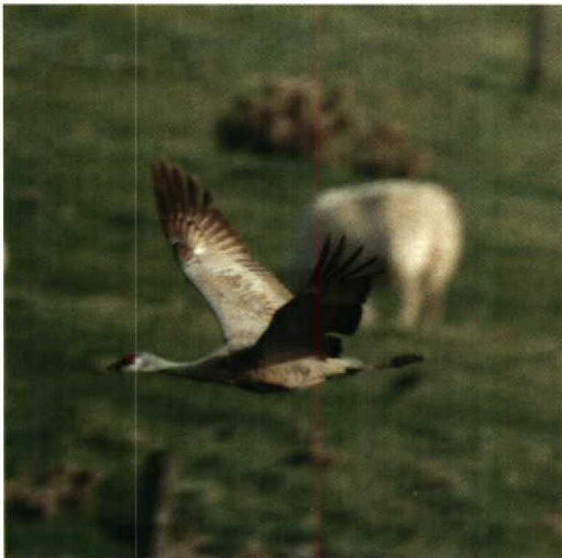
3-4 Canadese Kraanvogel / Sandhill Crane Grus canadensis , Sumburgh, Shetland, Schotland, september 1991 (Rob Wilson)

Omdat de Siberische broedpopulatie hemelsbreed verder van Europa leeft dan de Canadese, wordt in het algemeen aangenomen dat de Europese exemplaren uit Noordamerika afkomstig zijn. De soort is in Oost-Canada en in de Atlantische staten van de VS echter zeer zeldzaam. Bovendien volgen broedvogels van Noordwest-Canada normaliter een zuidwaartse trekroute. Wij achten een wilde herkomst uit Siberië niet onmogelijk als enkele Siberische vogels op weg