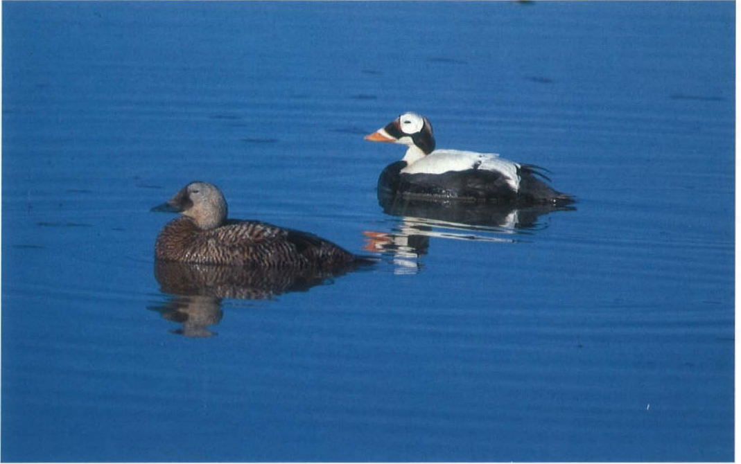
11 Spectacled Eiders / Brileiders Somateria fischeri , Deadhorse/Prudhoe Bay, Alaska, USA, 21 June 1991 (Arnold Meijer) 12 Spectacled Eider Somateria fischeri , Deadhorse/Prudhoe Bay, Alaska, USA, June 1991 (Peter Scova-Righini)