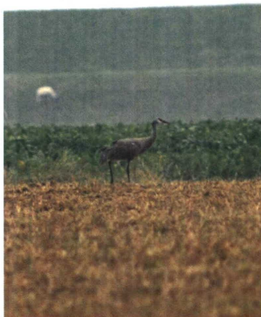
1 Canadese Kraanvogel / Sandhill Crane Grus canadensis , Paesens, Friesland, 29 september 1991 (Arnoud B van den Berg)