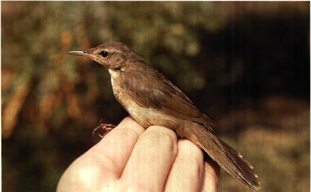
171 Styan's Grasshopper Warbler / Koreaanse Sprinkhaanzanger Locustella pleskei , Mai Po Marshes NR, Hong Kong, 9 September 1991

Middendorff's and Styan's occupy distinct breeding and wintering ranges and do not come into contact except occasionally in coastal China. During the breeding season, Middendorff's is confined to the maritime regions of eastern Russia which surround the Sea of Okhotsk including Sakhalin, Kamchatka, the Commander Islands and the Kuril Islands (Dement'ev & Gladkov 1968, Stepanyan 1990), as well as northern and eastern Hokkaido in northern Japan (Stepanyan 1990, Brazil 1991). In winter, it is found throughout the Philippines (Dickinson et al 1991) and has been recorded south to Sulawesi and Luang, Indonesia (White & Bruce 1986). As a migrant, Middendorff's was recorded by La Touche (1912, 1925-34) as passing in numbers at Shaweishan, an island 30 km off the mouth of the Yangtze