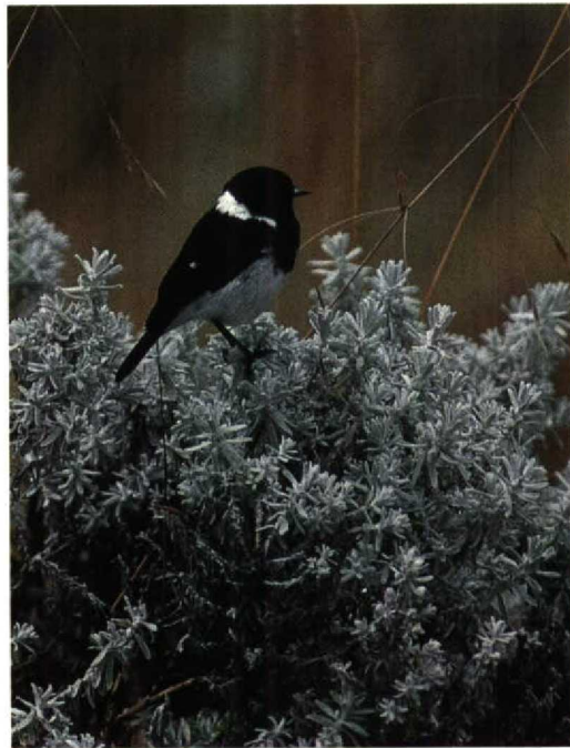
190 Blue-winged Goose / Blauwvleugelgans Cyanochen cyanopterus , Gaferson Reservoir, Addis Abeba, Ethiopia, December 1990 (Karel Beylevelt) 191 Ethiopian Stonechat / Ethiopische Roodborsttapuit Saxicola torquata albobasciata , Bale Mountains NP, Ethiopia, December 1990 (Karel Beylevelt) 192 African Paradise Flycatcher / Afrikaanse Paradijsmonarch Terpsiphone viridis ferreti , Sodore, Ethiopia, December 1990 (Karel Beylevelt)