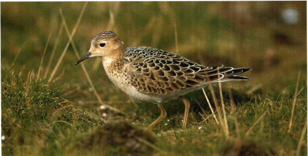
212 Blonde Ruiters / Buff-breasted Sandpiper Tryngites subruficollis , Zeebrugge, Westvlaanderen, België, september 1993 (Patrick Beirens)

KRAANVOGELS TOT ALKEN De eerste zeven Kraanvogels Grus grus vlogen op 8 september over Oostende. Op 2 oktober werd wellicht steeds dezelfde groep van 21 gezien boven Lier, Oud-Heverlee, Brabant en Mechelen, Antwerpen. Van 20 tot 27 oktober zaten er vier bij het Schulensmeer, Limburg. Daarna volgden (vooral tussen 20 en 30 oktober) waarnemingen te