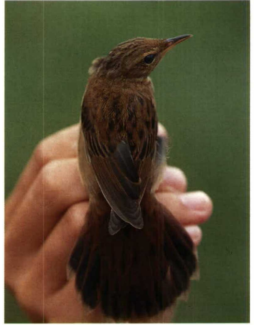
172 Pallas's Grasshopper Warbler / Siberische Sprinkhaanzanger Locustella certhiola , Beidaihe, China, 24 May 1991 (Peter R Kennerley) 173 Pallas's Grasshopper Warbler / Siberische Sprinkhaanzanger Locustella certhiola rubescens , Luk Keng, China, 6 September 1992 (Peter R Kennerley) 174 Pallas's Grasshopper Warbler / Siberische Sprinkhaanzanger Locustella certhiola , Beidaihe, China, 24 May 1991 (Peter R Kennerley)