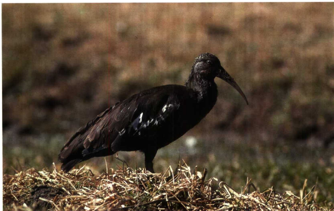
185 Wattled Ibis / Lelibis Bostrychia carunculata , Lake Langano, Ethiopia, December 1990