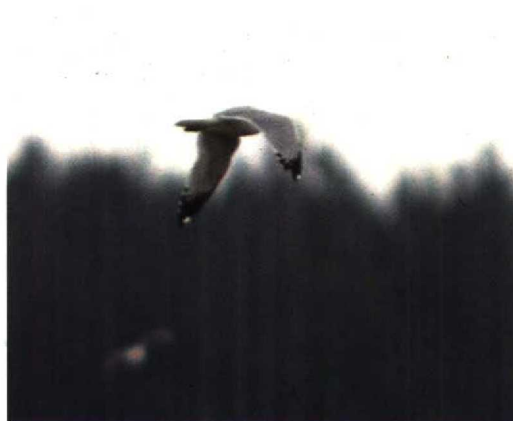
175 Ringsnavelmeeuw / Ring-billed Gull Larus delawarensis , adult zomerkleed, Wuustwezel, Antwerpen, België, 18 april 1992; top van of gehele p8 rechts ontbreekt

Het normale verspreidingsgebied van de Ringsnavelmeeuw is Noordamerika. Voor het voorkomen in de WP tot en met 1987 zij verwezen naar Hoogendoorn & Steinhaus (1990). Tot en met