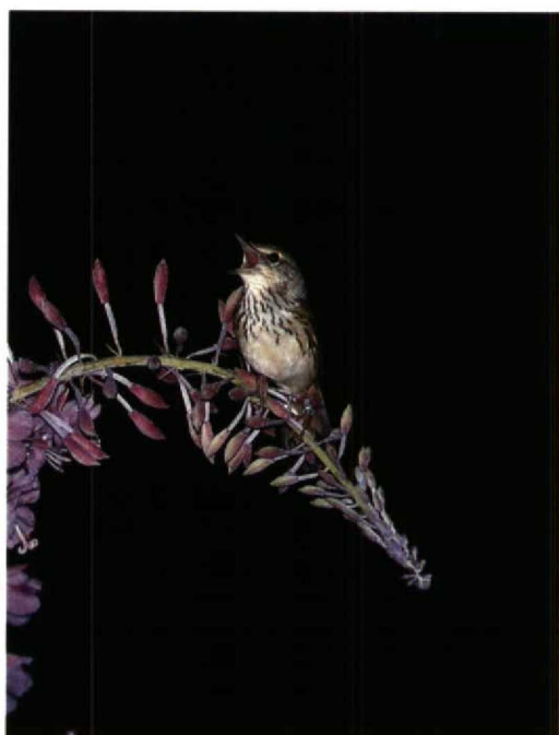
196 Red-flanked Bluetail / Blauwstaart Tarsiger cyanurus , Winspit Valley, Dorset, England, October 1993 197 Lanceolated Warbler / Kleine Sprinkhaanzanger Locustella lanceolata , Hankasalmi, Finland, 17 July 1993 198 Black-eared Wheatear / Blonde Tapuit Oenanthe hispanica , first-winter male, Stiffkey, Norfolk, England, October 1993