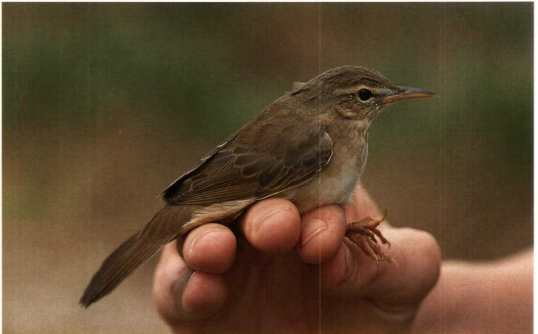
170 Styan's Grasshopper Warbler / Koreaanse Sprinkhaanzanger Locustella pleskei , Mai Po Marshes NR, Hong Kong, 17 April 1992

The dark centres and paler fringes to the mantle-feathers and conspicuous rufous rump of Pallas's preclude any possibility of confusion with Styan's in which these features are almost entirely suppressed. Indeed, Styan's is more likely to be mistaken for Oriental Reed Warbler Acroce-