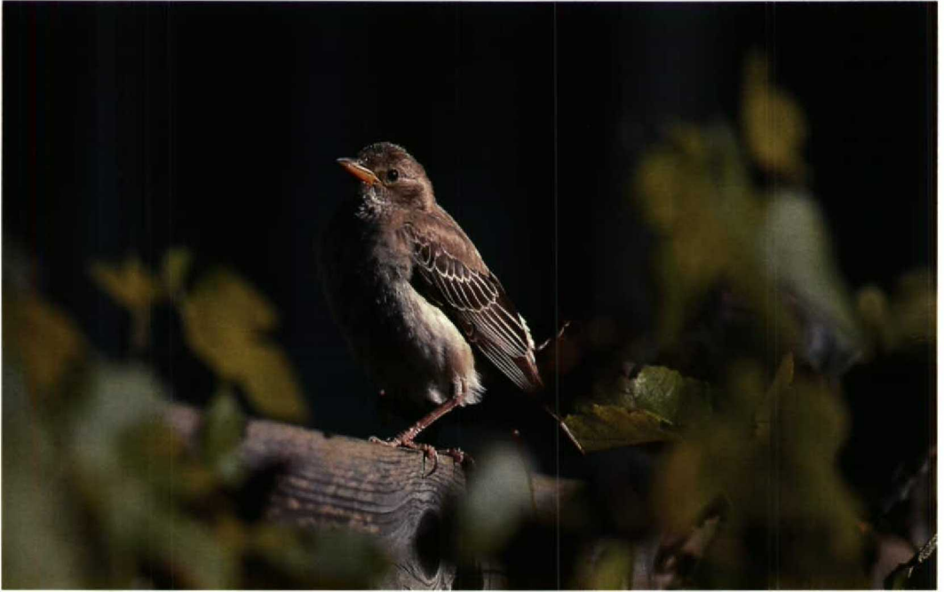
211 Roze Spreeuw / Rosy Starling Sturnus roseus , De Cocksdorp, Texel, Noordholland, oktober 1993 (Hans Gebuis)

Schiermonnikoog op 7 september. Dit najaar werd Nederland overspoeld door Zwarte Mezen Parus ater , met bijvoorbeeld een waarneming van 670 exemplaren trekkend langs Vlissingen, Zeeland, op 7 september. Een aardige influx van Taigaboomkruipers Certhia familiaris zorgde voor een vangst op 1 oktober te Bloemendaal, Noordholland, en waarnemingen op 9 oktober in het Wilgenbos langs de Oostvaardersdijk, van 14 tot 22 oktober op Terschelling (drie), van 16 tot 29 oktober op Schiermonnikoog (waaronder ook een vangst), op 22 oktober te Zeist, Utrecht, van 24 oktober tot in november in Lauwersoog, van 28 tot 31 oktober op Texel en van 29 tot 31 oktober op Vlieland (twee). Een 30-tal Buidelmezen Remiz pendulinus werd, voornamelijk op trektelposten, verspreid over het hele land waargenomen. Op 21 oktober werd aan het eind van de middag bij de Hooge Berg op Texel een eerste-winter Izabelklauwier Lanius isabellinus waargenomen. Tussen 18 september en 15 oktober werden acht Grauwe Klauwieren L. collurio gemeld en een onvolwassen Roodkopklauwier L. senator zat op 4 en 5 september op Schiermonnikoog. Meer of minder serieuze waarnemingen van Notekrakers Nucifraga caryocatactes werden opgetekend op 21 september te Son, Noordbrabant, op 5 oktober te Kampen, op 19 oktober te