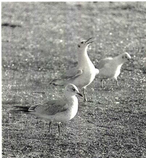
184 Possible hybrid Common Gull x Mediterranean Gull / mogelijke hybride Stormmeeuw x Zwartkopmeeuw Larus canus x melanocephalus , Groningen, Groningen, January 1991

ing from eye to crown and streaking on neck, breast and flanks for Common Gull. The scapulars, coverts and tertials are quite similar to those shown by some retarded first-winter Common Gulls. The head shape looks more like Mediterranean Gull, the breast more like Common Gull. The colour of the legs fits better on this hybrid type than on the other two possibilities. The small ear-patch could be a remnant of the dark ear coverts shown by some Mediterranean Gulls.