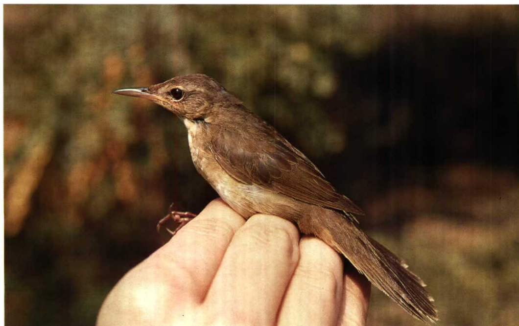
171 Styan's Grasshopper Warbler / Koreaanse Sprinkhaanzanger Locustella pleskei , Mai Po Marshes NR, Hong Kong, 9 September 1991 (Peter R Kennerley)

Middendorff's and Styan's occupy distinct breeding and wintering ranges and do not come into contact except occasionally in coastal China. During the breeding season, Middendorff's is confined to the maritime regions of eastern Russia which surround the Sea of Okhotsk including Sakhalin, Kamchatka, the Commander Islands and the Kuril Islands (Dement'ev & Gladkov 1968, Stepanyan 1990), as well as northern and eastern Hokkaido in northern Japan (Stepanyan 1990, Brazil 1991). In winter, it is found throughout the Philippines (Dickinson et al 1991) and has been recorded south to Sulawesi and Luang, Indonesia (White & Bruce 1986). As a migrant, Middendorff's was recorded by La Touche (1912, 1925-34) as passing in numbers at Shaweishan, an island 30 km off the mouth of the Yangtze