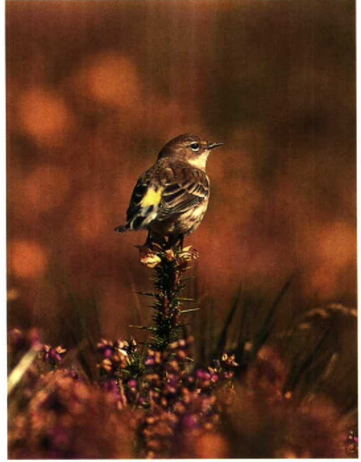
193 Blyth's Pipit / Mongoolse Pieper Anthus godlewskii , St Mary's, Scilly, England, October 1993 (David Tipling) 194 Yellow-rumped Warbler / Geelstuitzanger Dendroica coronata , Cape Clear, Cork, Ireland, 10 October 1993 (Anthony McGeehan) 195 Upland Sandpiper / Bartrams Ruitter Bartramia longicauda , St Mary's, Scilly, England, October 1993 (David Tipling)