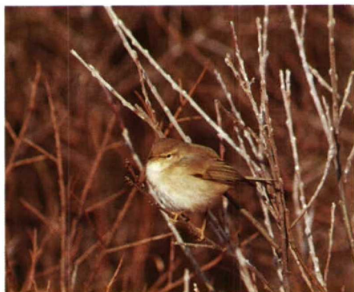
181 Tjiftjaf / Chiffchaff Phylloscopus collybita , IJmuiden, Noordholland, december 1992

Conder, P J & Keighley, J 1950. The leg colouration of the Willow-Warbler and Chiffchaff. Br Birds 43: 238-240.