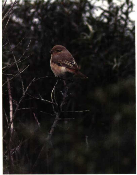
199 Paddyfield Warbler / Veldrietzanger Acrocephalus agricola , Helgoland, Germany, 5 October 1993 ( Arnoud B van den Berg ) 200 Isabelline Shrike / Izabelklauwier Lanius isabellinus , Helgoland, Germany, 2 October 1993 ( Arnoud B van den Berg ) 201 Pied Wheatear / Bonte Tapuit Oenanthe pleschanka , first-winter male, Vlieland, Friesland, Netherlands, 7 October 1993 ( Raymond van Splunder ) 202 Sardinian Warbler / Kleine Zwartkop Sylvia melanocephala , Lauwersoog, Groningen, Netherlands, 31 October 1993 ( Eric Koops )