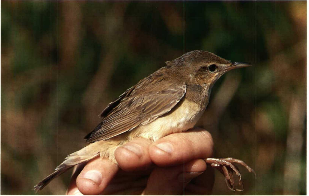
167-168 Middendorff's Grasshopper Warbler / Japanse Sprinkhaanzanger Locustella ochotensis , Candaba, Philippines, 6 February 1992 (Peter R Kennerley) 169 Styan's Grasshopper Warbler / Koreaanse Sprinkhaanzanger Locustella pleskei , Mai Po Marshes NR, Hong Kong, 17 April 1992 (Peter R Kennerley)