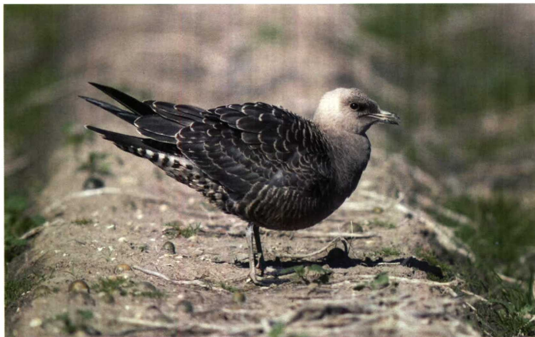
203 Kleinste Jager / Long-tailed Skua Stercorarius longicaudus , Breezand, Noordholland, 5 september 1993 ( Marten van Dijl ) 204 Morinelplevier / Dotterel Charadrius morinellus , Maasvlakte, Zuidholland, 9 september 1993 ( Marjolein Bayens )