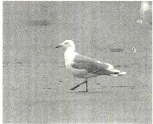
180 Herring Gull / Zilvermeeuw Larus argentatus argentatus , adult, with black marks on wing-tip probably restricted to two or three outermost primaries, IJmuiden, Noordholland, 10 February 1990 (Jaap van 't Hof)