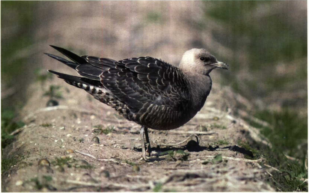
203 Kleinste Jager / Long-tailed Skua Stercorarius longicaudus , Breezand, Noordholland, 5 september 1993 ( Marten van Dijl ) 204 Morinelplevier / Dotterel Charadrius morinellus , Maasvlakte, Zuidholland, 9 september 1993 ( Marjolein Bayens )