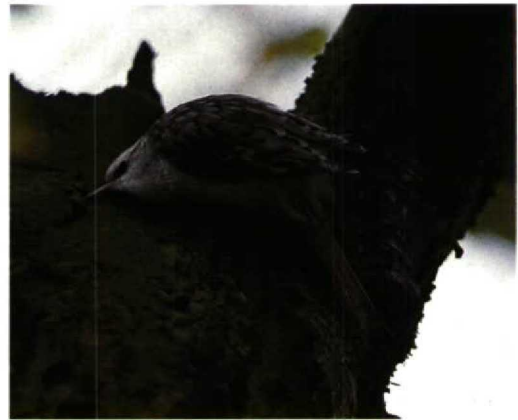
205 Hop / Hoopoe Upupa epops , Texel, Noordholland, oktober 1993 206 Zwarte Ibis / Glossy Ibis Plegadis falcinellus , Wolphaartsdijk, Zeeland, oktober 1993 207 Grote Pieper / Richard's Pipit Anthus richardi , IJmeerdijk, Almere, Flevoland, 11 september 1993 208 Taigaboomkruiper / Eurasian Treecreeper Certhia familiaris , Terschelling, Friesland, oktober 1993

tweetallen op 11 september bij de Eemshaven, Groningen, en op 9 en 10 oktober bij het Zwanenwater, Noordholland. Rosse Franjepoten P. fulicarius werden gemeld op 25 september in de Bandpolder, Friesland, op 28 september bij Ransdorp, Noordholland, op 2 oktober op Schiermonnikoog, Friesland, en bij Scheveningen, Zuidholland, op 11 en 14 oktober op Terschelling, op 17 oktober op Engelsmanplaat, Friesland, en op 26 oktober langs Callantsoog, Noordholland. C 70 Middelste Jagers Stercorarius pomarinus werden tot 3 oktober langs de kust genoteerd. Kleinste Jagers S. longicaudus werden opgemerkt op 2 september en 15 september (twee) bij Camperduin, op 3 september langs de Oostvaardersdijk, Flevoland, op 4 en 5 september bij Breezand, Noordholland, op 6 september op Texel, op 12 september op Terschelling, op 16 september bij Westkapelle, op 18 september op de Maasvlakte en op 26 september bij Egmond aan Zee,