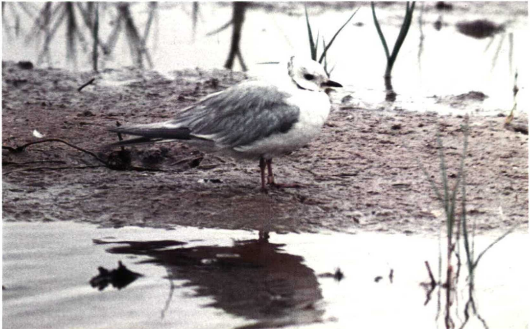
8 Ross' Meeuw / Ross's Gull Rhodostethia rosea , Vlieland, Friesland, juni 1958