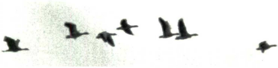
2 Canadese Kraanvogel / Sandhill Crane Grus canadensis met Grauwe Ganzen / Greylag Geese Anser anser , Paesens, Friesland, 29 september 1991 (Arnoud B van den Berg)