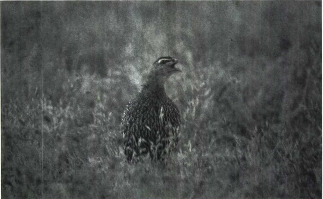
9 Moroccan Double-spurred Francolin Francolinus bicalcaratus ayesha , Rabat, Morocco, July 1987