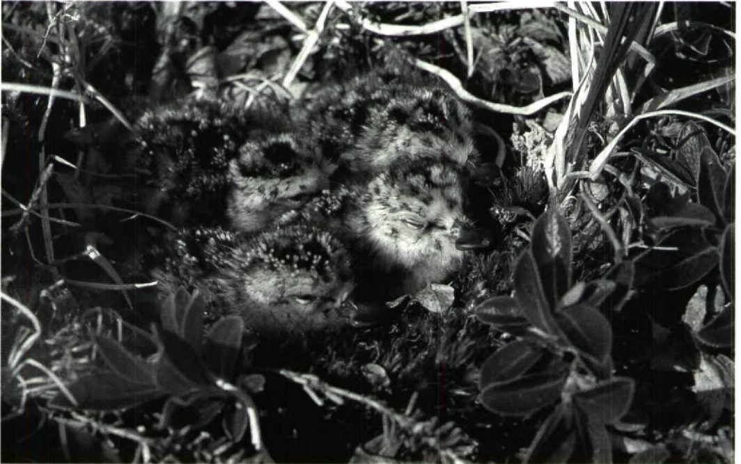
44 Spoon-billed Sandpiper Eurynorhynchus pygmeus , chicks in nest, Belyaka Spit, Kolyuchinskaya Gulf, northern Chukotski peninsula, Russia, 16 July 1987 (Pavel S Tomkovich)

desh, including two individuals colour-marked on the northern Chukotski peninsula! The only other recovery was received recently through the Asian Wetland Bureau from Hangzhou Bay near the mouth of the Yangtze, China. The bird was ringed as a chick in 1987, shot by a hunter on 10 May 1990 and subsequently eaten. These are the first and only recoveries to date of this species.