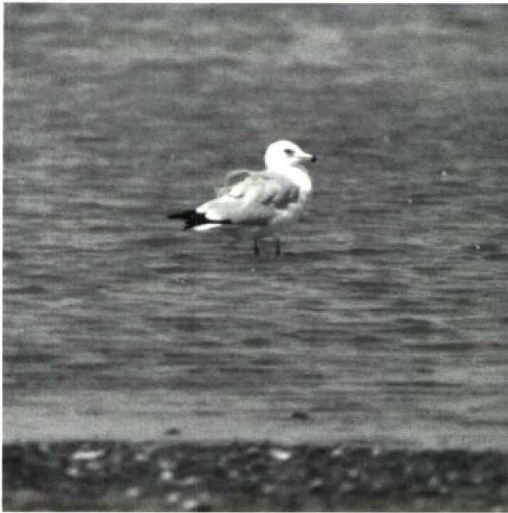
54 Ring-billed Gull Larus delawarensis , adult-winter, Palmarin, Sine-Saloum, Senegal, 12 October 1985 (François Baillon)

Hann, Dakar, Senegal, first-winter (P J Dubois, P Le Maréchal et al).