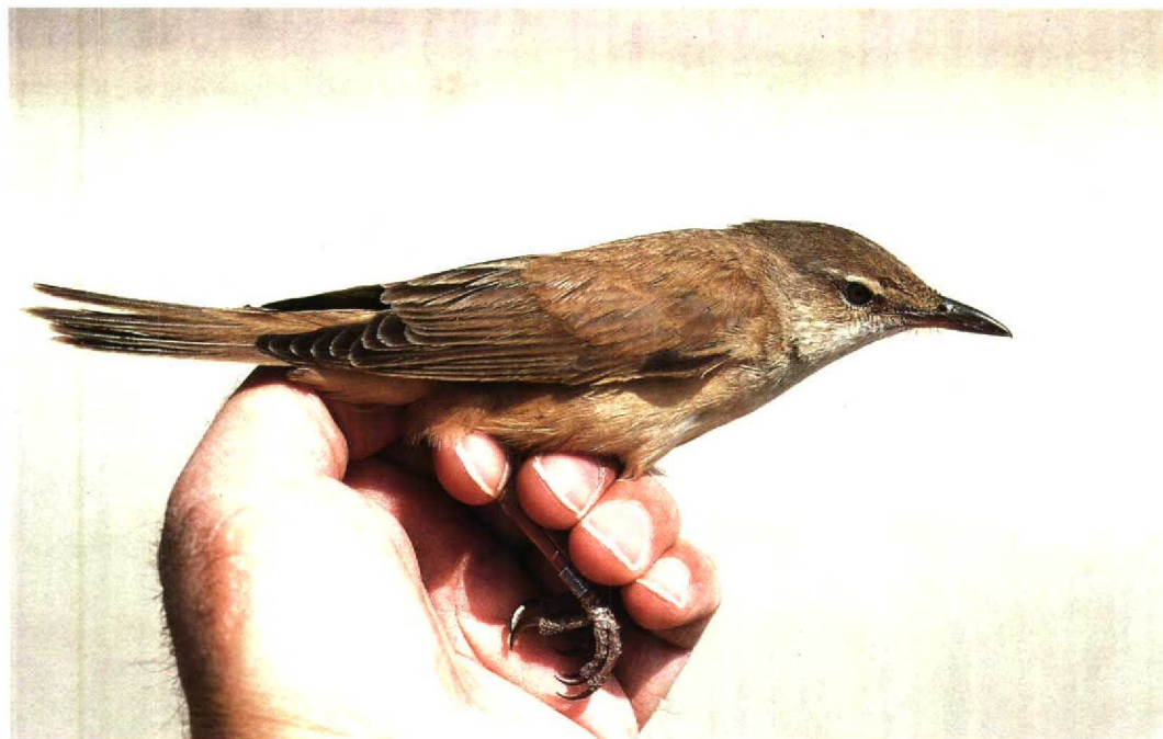
50 Eastern Great Reed Warbler Acrocephalus arundinaceus zarudnyi , Jubayl, Saudi Arabia, 14 April 1991