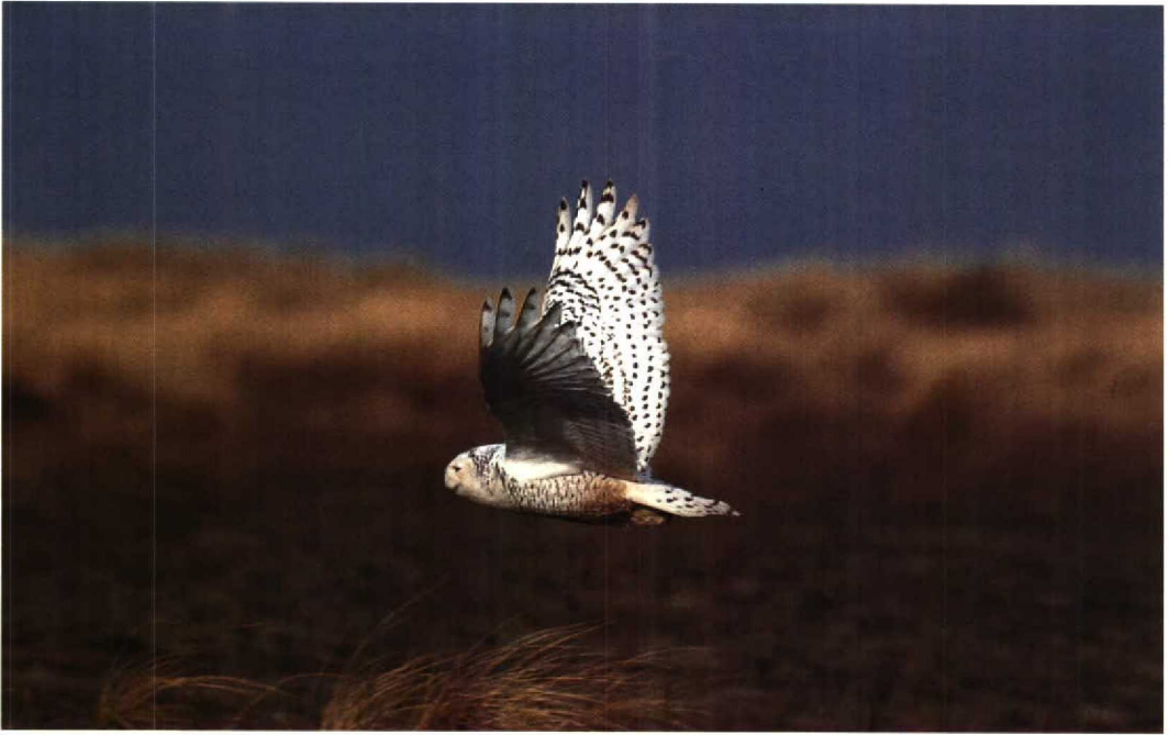
67-68 Sneeuwuil Nyctea scandiaca , Maasvlakte, Zuidholland, maart 1992 (René Pop)