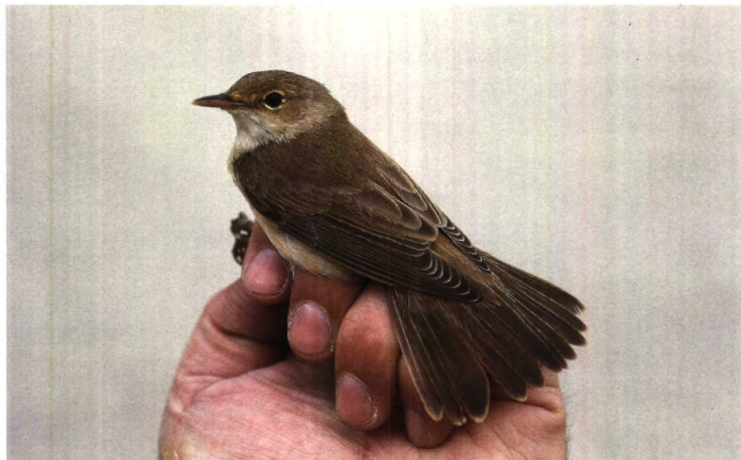
51 Eastern Reed Warbler Acrocephalus scirpaceus fuscus , Jubayl, Saudi Arabia, 16 April 1991 (Arnoud B van den Berg)