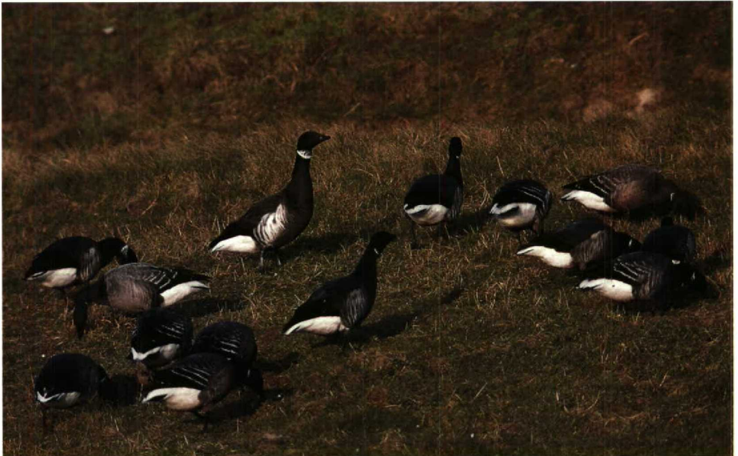
61 Black-throated Thrush Turdus ruficollis atrogularis , first-winter male, Giessen, Hessen, Germany, February 1992 62 Black Brant Branta bernicla nigricans , Dark-bellied Brent Geese B. b. bernicla and two 'hybrid' juveniles Black Brant x Dark-bellied Brent Goose, Grevelingendam, Zeeland, Netherlands, 22 January 1992

Ireland. The Rufous Turtle Dove Streptopelia orientalis remained at Mörbylånga, southern Öland, Sweden. In western Europe, away from the usual sites, Snowy Owls Nyctea scandiaca were reported in January from Sweden (only two), on 19 February from Achill Island, Mayo, Ireland, and from 8 March to 1 April on the Maasvlakte, Zuidholland, Netherlands. In North America, it has been a good winter for owls with record numbers of Hawk Owl Surnia ulula and Great Grey Owl Strix nebulosa in northern Minnesota and parts of Michigan, USA, and good numbers, also of Tengmalm's Owl Aegolius funereus , near Ottawa and Toronto, Ontario, Canada. An unseasonal Short-toed Lark Calandrella brachydactyla was trapped at Spurn, Humberside, England, on 12 January. From late January into March, a first-winter male Black-throated Thrush Turdus ruficollis atrogularis was staying with a flock of Fieldfares T. pilaris near Giessen, Hessen, Germany. About the fifth Hume's Yellow-browed Warbler Phylloscopus humei for Sweden was at Ystad, Skåne, from 4 to 23 January, and the second for Germany was one wintering near Bonn, Nordrhein-Westfalen, from mid-February into March. In England, not only a Hume's Yellow-browed Warbler was wintering, in Plymouth, Devon, from 13 January into March, but also a Yellow-browed Warbler P. inornatus , at Hayle Mill Pond, Cornwall, from 1 to at least 20 January. Wintering male Pine Buntings Emberiza leucocephalos in England at-