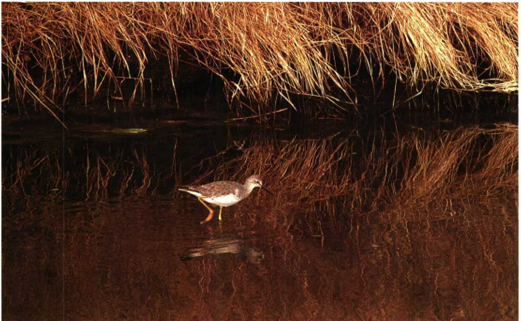
55 Kleine Geelpootruiter Tringa flavipes , adult winter, nabij Flauwersinlaag, Zeeland, oktober 1991 (Hans Gebuis)

De waarneming van deze Kleine Geelpootruiter