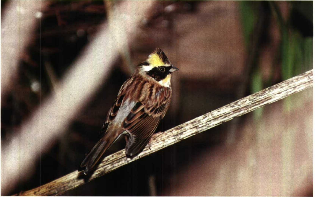
58 Yellow-throated Bunting Emberiza elegans , male in captivity, Britain, November 1991 (Colin Bradshaw)

Mystery photograph 46. Solution in next issue