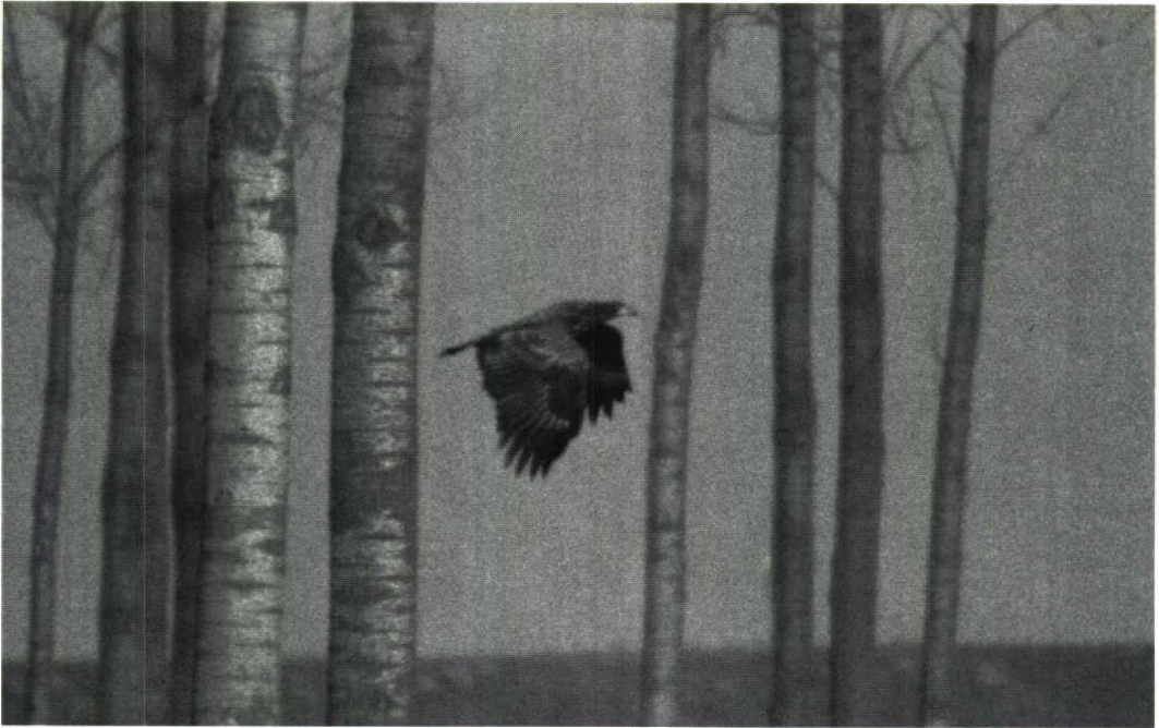
66 Zearend Haliaeetus albicilla , Verdrongen land van Saeftinge, Zeeland, februari 1992

op deze datum werd er ook één gezien bij Goessche Sas Z. Op 25 februari zat er één langs de Brouwersdam Zh. Het vermelden waard is de waarneming van een Noordse Pijlstormvogel Puffinus puffinus die op 2 januari langs Camperduin vloog. Op 4 januari vloog daar ook een Vaal Stormvogeltje Oceanodroma leucorhoa langs. Tot 31 januari werden maximaal drie Kuifaalscholwers Phalacrocorax aristotelis gezien in de wijde omgeving van Vlissingen. Op 4 januari zat er één bij de Eemshaven Gr en op 24 januari één bij Den Helder Nh. Een Kleine Zilverreiger Egretta garzetta bleef de gehele periode aanwezig in de omgeving van Vliegvelde Midden-Zeeland bij het Veerse Meer Z. Ook bleek er (nog steeds) één exemplaar aanwezig bij Oudeschild op het eiland Texel Nh op 28 en 29 februari. Tot 26 januari was de Grote Zilverreiger E alba van Nuland Nb nog present, van 1 tot 21 februari verbleef er één bij Dordrecht Zh en vanaf 27 februari werd er weer één in de Oostvaardersplassen Fl gezien. Op 2 januari zaten nog vijf Dwergganzen Anser erythropus bij Anjum Fr en op 10 januari nog drie bij Strijen Zh. Andere exemplaren zaten van 10 januari tot 25 februari bij Den Bommel Zh, op 12 januari en 14 februari in de Ooypolder Gld, op 18 januari in de Kievitslanden Fl, op 21 januari bij Gaast Fr, op 24 januari zes exemplaren bij Groot-Amers Zh, van 8 tot 10 februari bij Zeewolde Fl en op 9 februari bij Marle Gld. Aangenomen dat het steeds dezelfde groep van zeven Sneeuwanzen A caerulescens betreft, volgt hier een