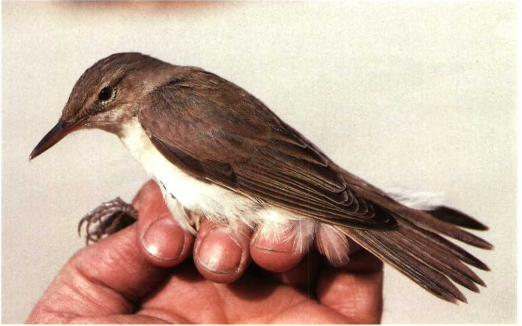
48 Basra Reed Warbler Acrocephalus griseldis , Jubayl, Saudi Arabia, 4 May 1991 (Arnoud B van den Berg)