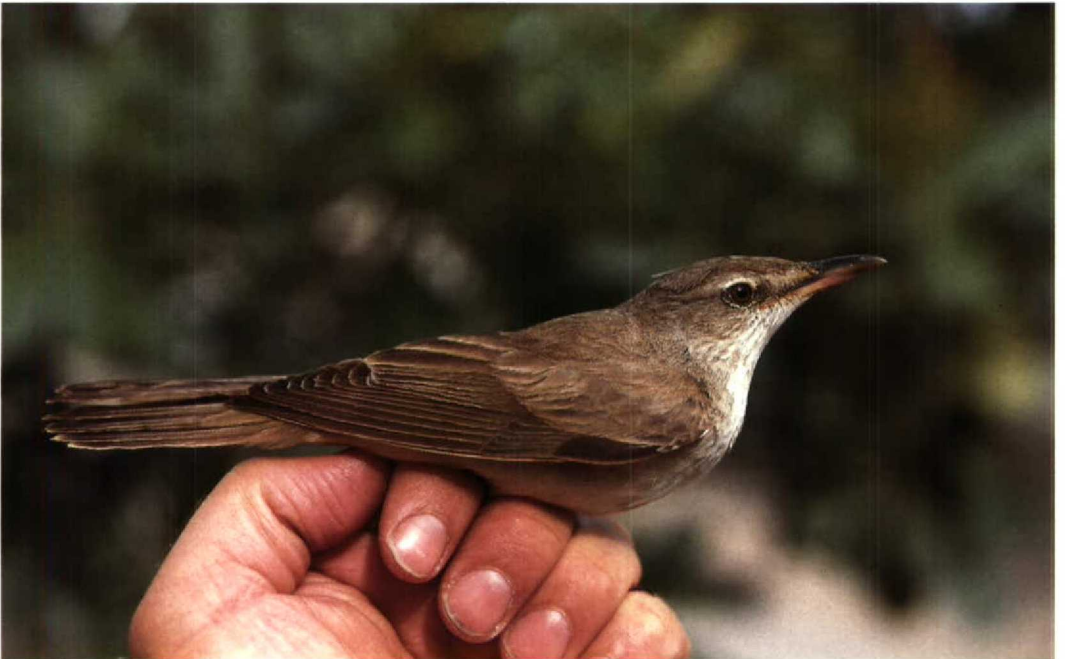
49 Eastern Great Reed Warbler Acrocephalus arundinaceus zarudnyi , Jubayl, Saudi Arabia, 9 April 1991 (Arnoud B van den Berg)