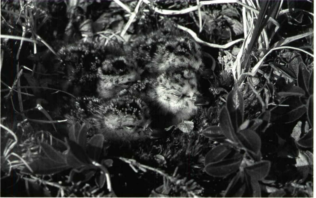
44 Spoon-billed Sandpiper Eurynorhynchus pygmeus , chicks in nest, Belyaka Spit, Kolyuchinskaya Gulf, northern Chukotski peninsula, Russia, 16 July 1987 (Pavel S Tomkovich)

desh, including two individuals colour-marked on the northern Chukotski peninsula! The only other recovery was received recently through the Asian Wetland Bureau from Hangzhou Bay near the mouth of the Yangtze, China. The bird was ringed as a chick in 1987, shot by a hunter on 10 May 1990 and subsequently eaten. These are the first and only recoveries to date of this species.