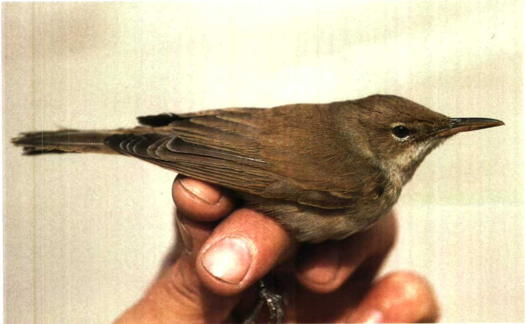
47 Basra Reed Warbler Acrocephalus griseldis , bill showing old fracture at base, Jubayl, Saudi Arabia, 1 May 1991 (Arnoud B van den Berg)